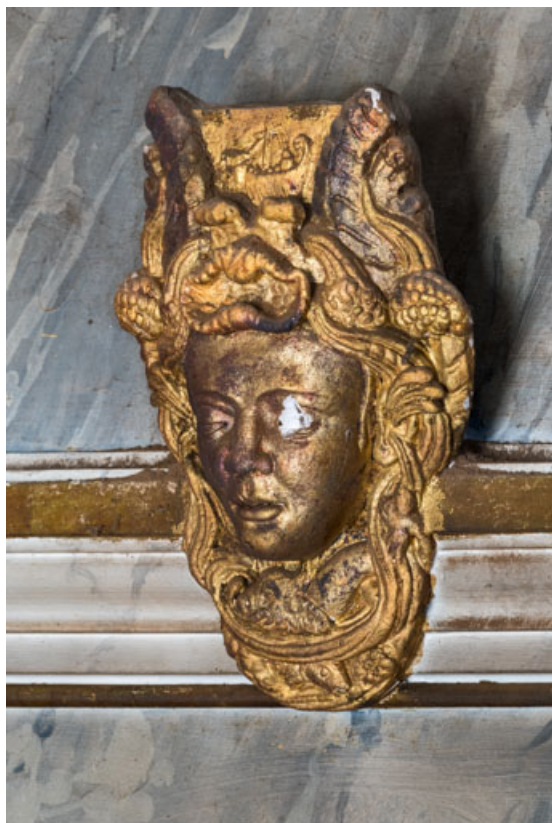
Masque (tête de femme).