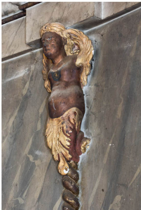
Terme en console ailés.