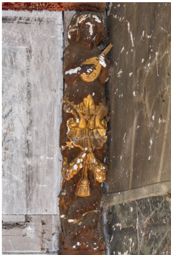
Terme musicien sur le garde-corps du balcon.