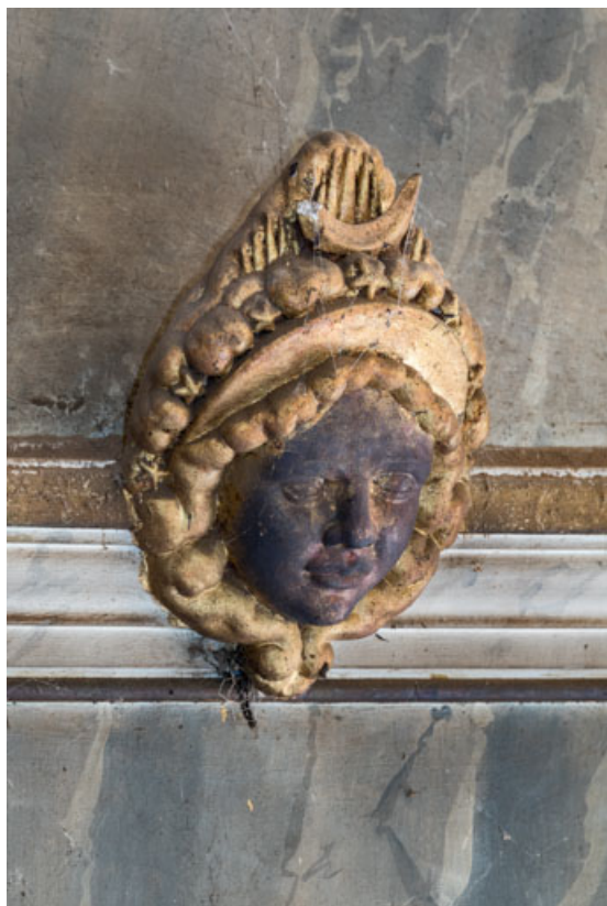
Masque (tête de femme), de trois quarts : Sélééné. 71, Sully, 4 rue du Château