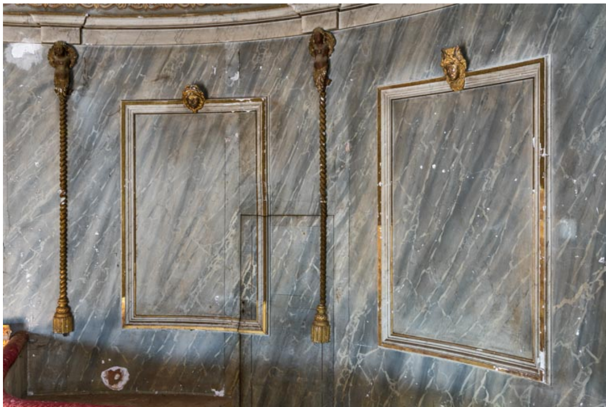
Théâtre, balcon : décor peint et porte dérobée.