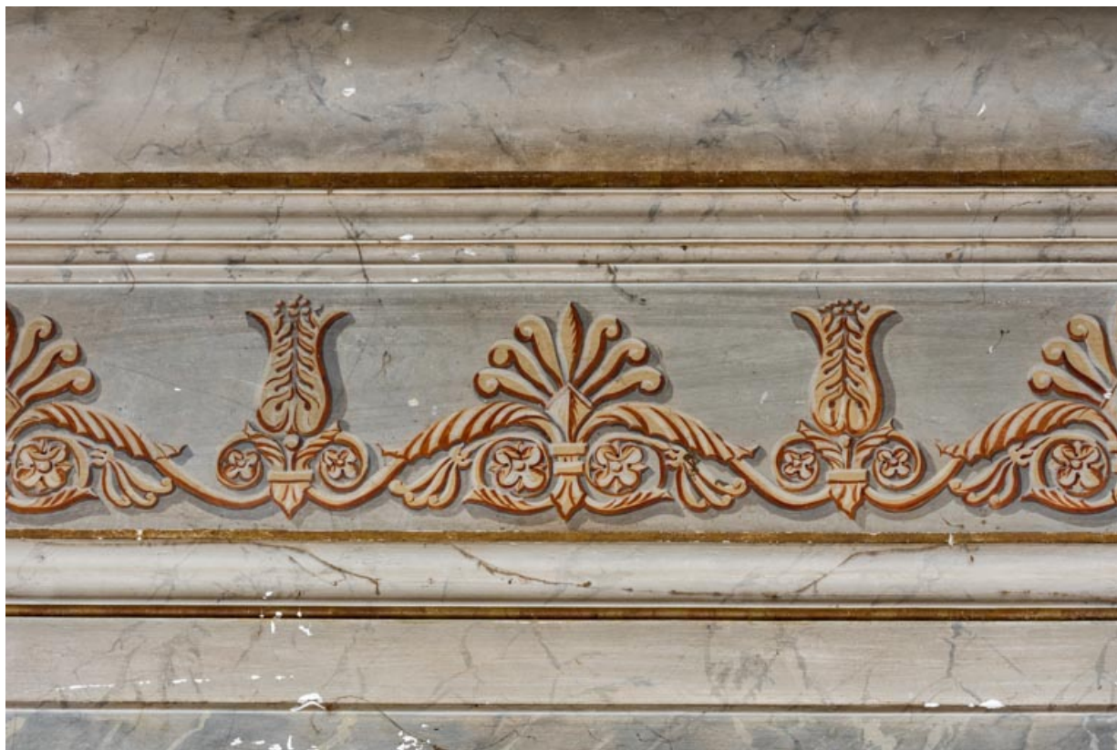
Frise peinte de l'entablement.