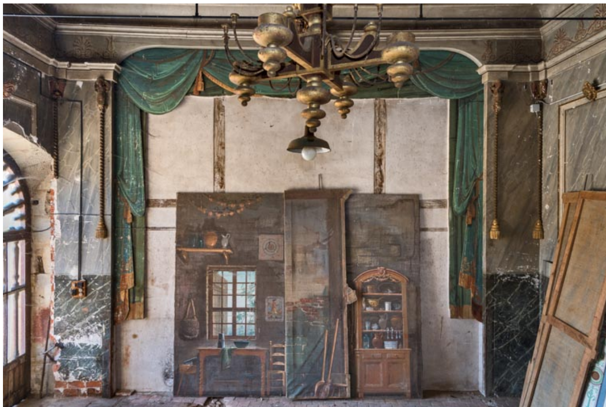
Théâtre : le cadre de scène, depuis le balcon.