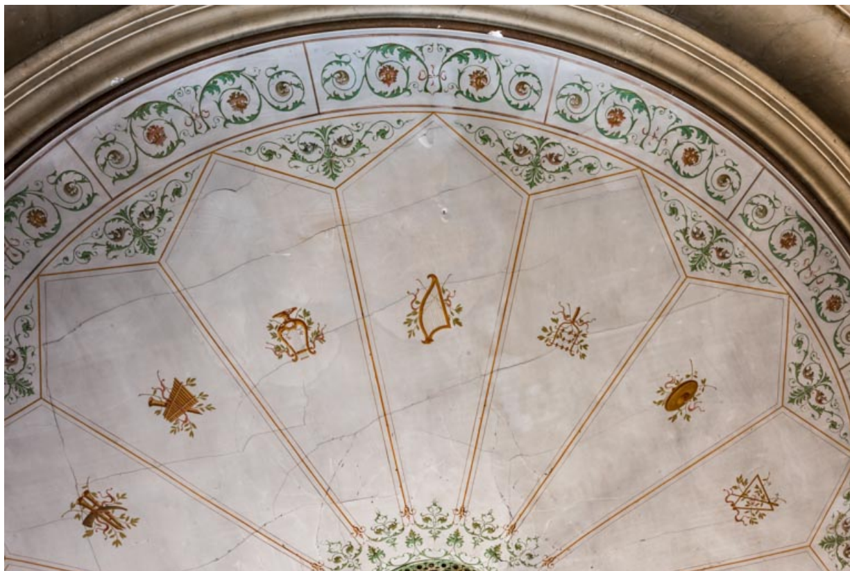
Peinture du plafond : détail.