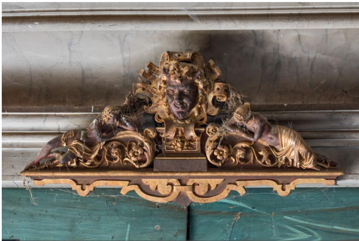
Masque (tête de satyre) et personnages, en haut du cadre de scène.