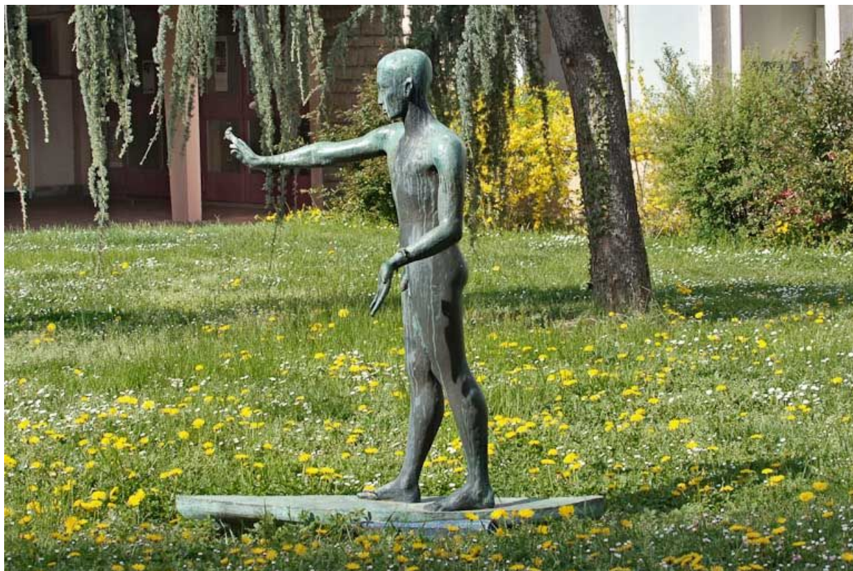
Vue d'ensemble, latérale.