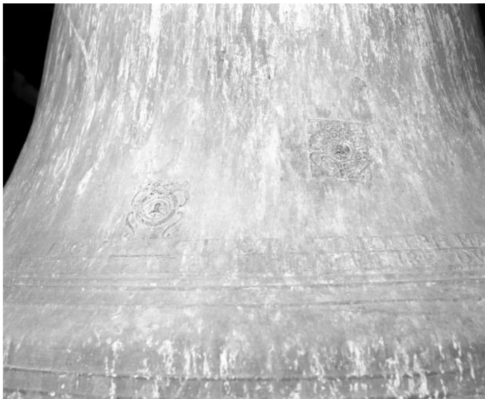
Détail des cachets de fondeurs.

71, rue de la Verdun-sur-le-Doubs République