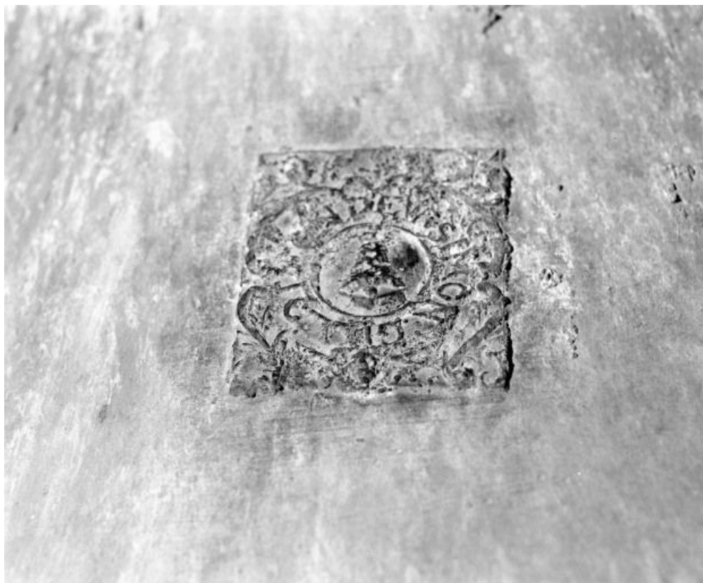
Détail du cachet droit.

71, rue de la Verdun-sur-le-Doubs République