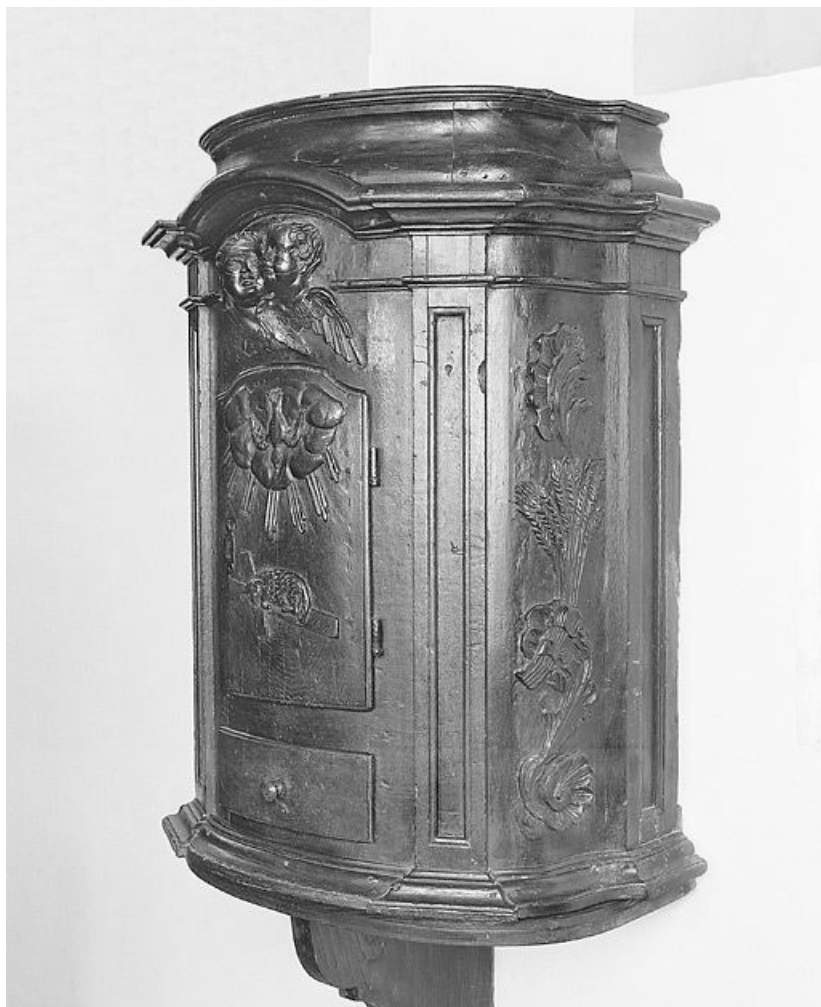
Vue de trois-quarts gauche.