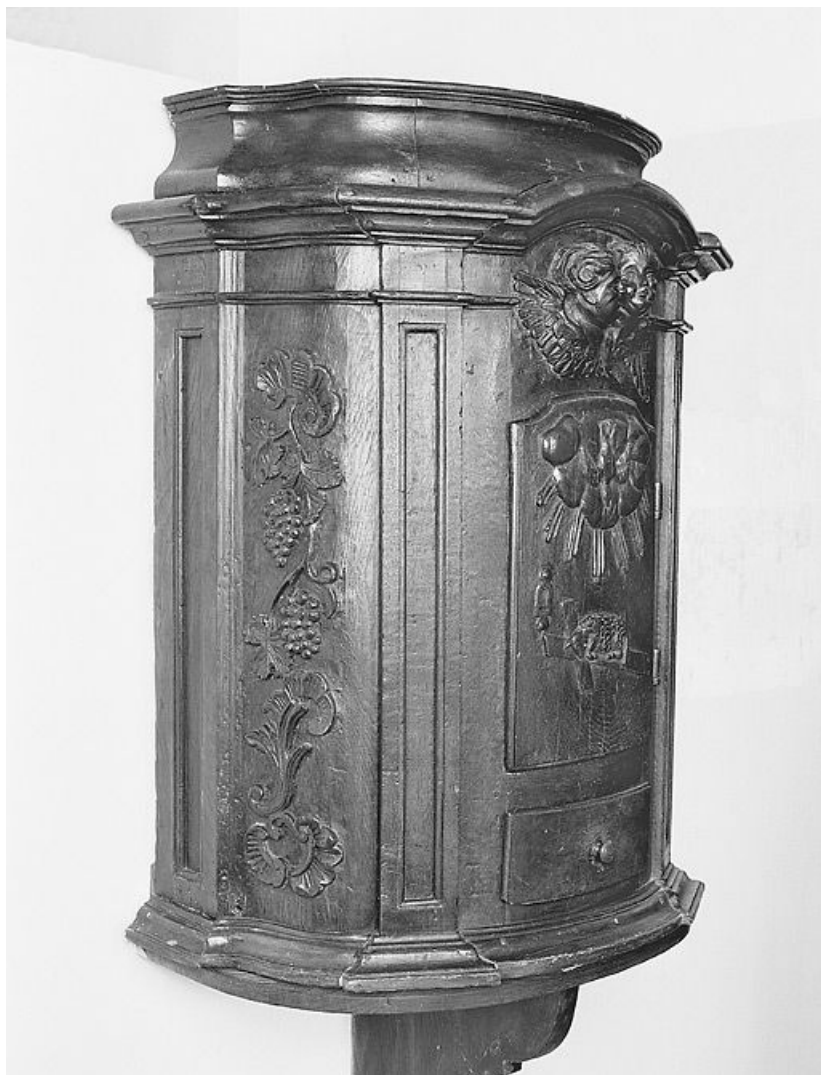
Vue de trois-quarts droit.