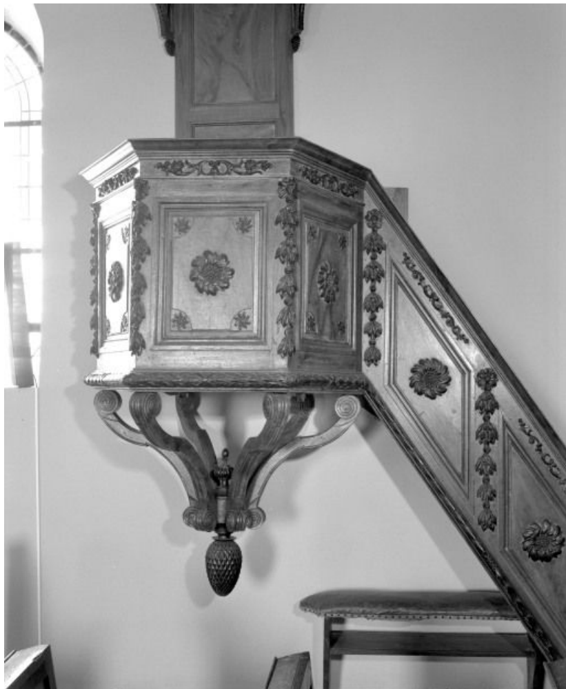
Cuve. 71, Longepierre Bourg