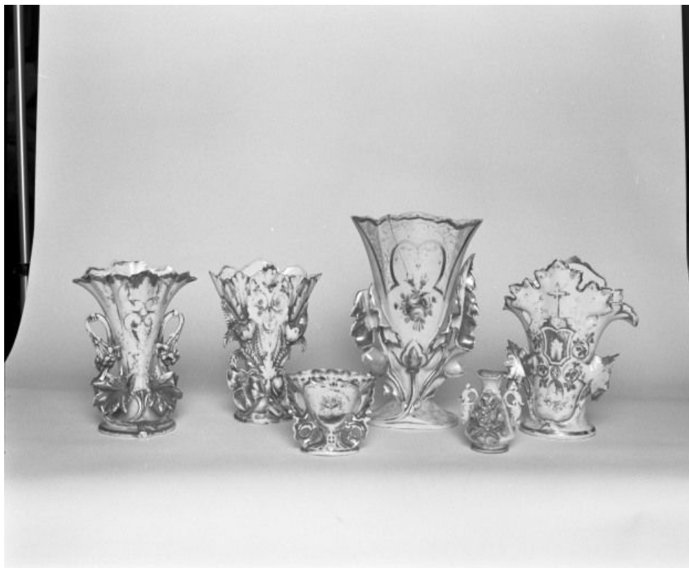
Vue d'ensemble. 71, Écuellen Eglise