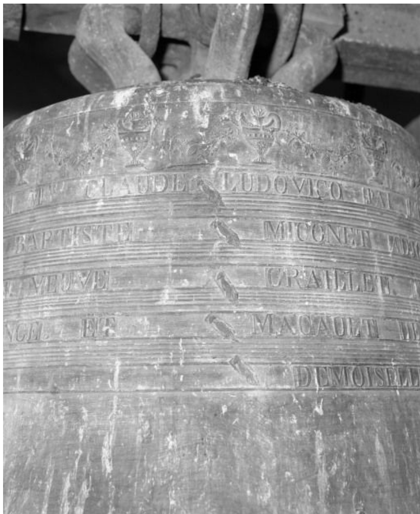
Détail : vase supérieur.