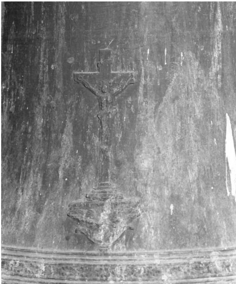
Détail : Christ en croix.