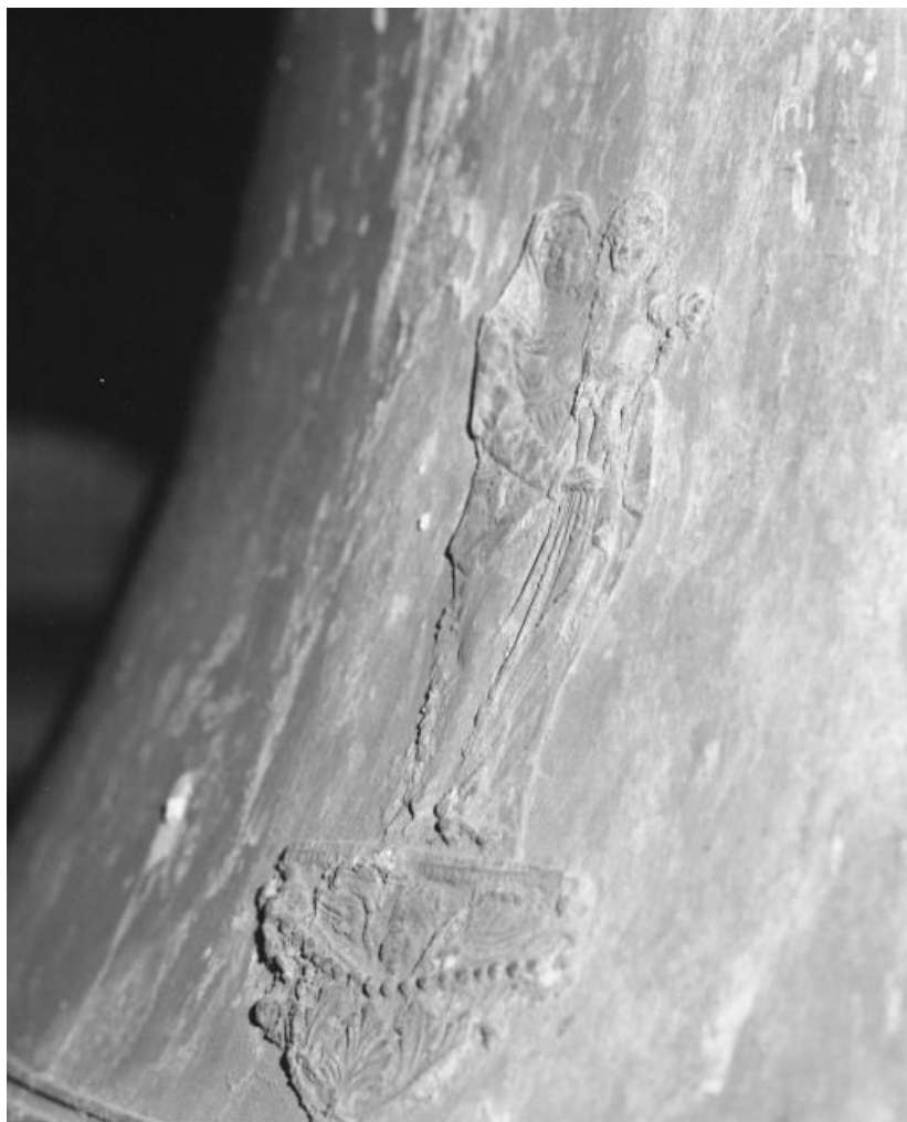
Détail : Vierge à l'Enfant.