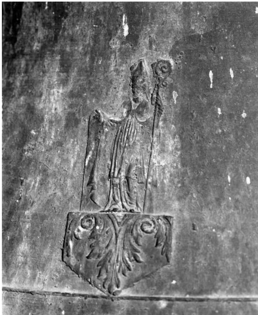
Détail : saint évêque.