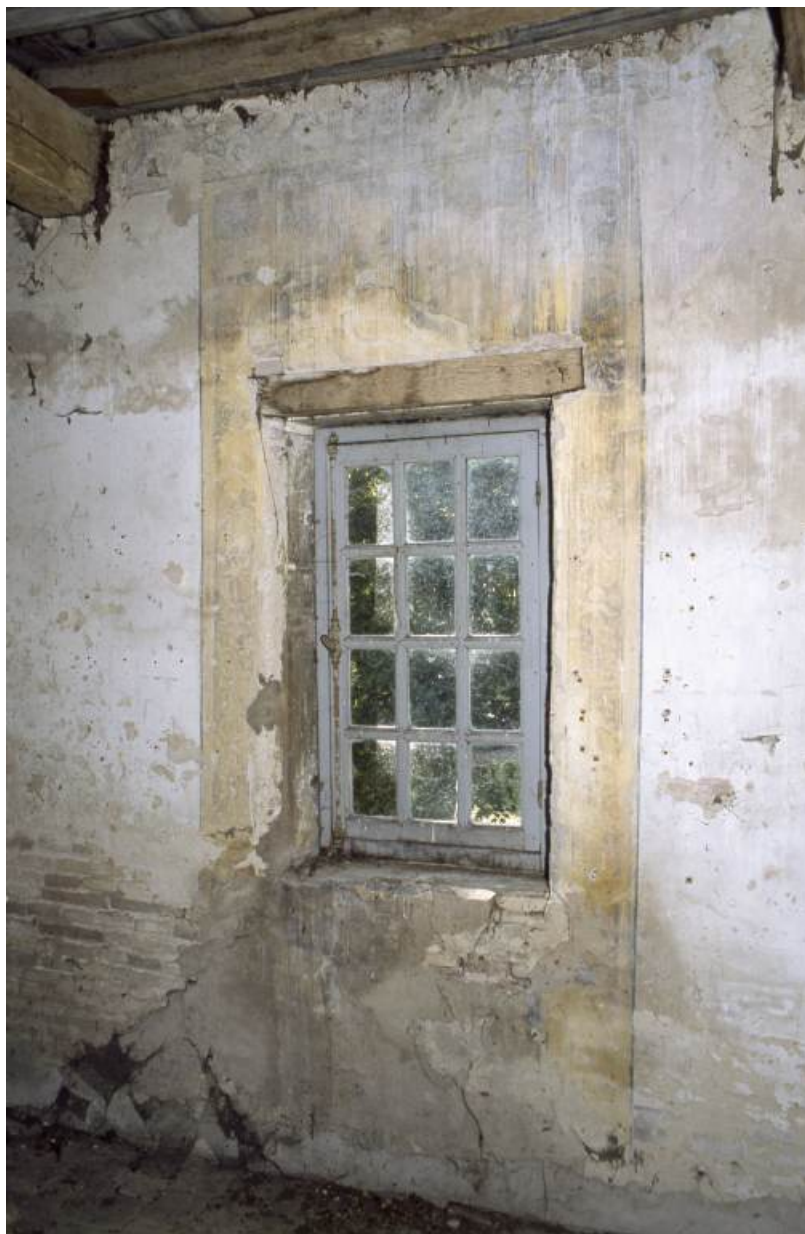
Vue de détail