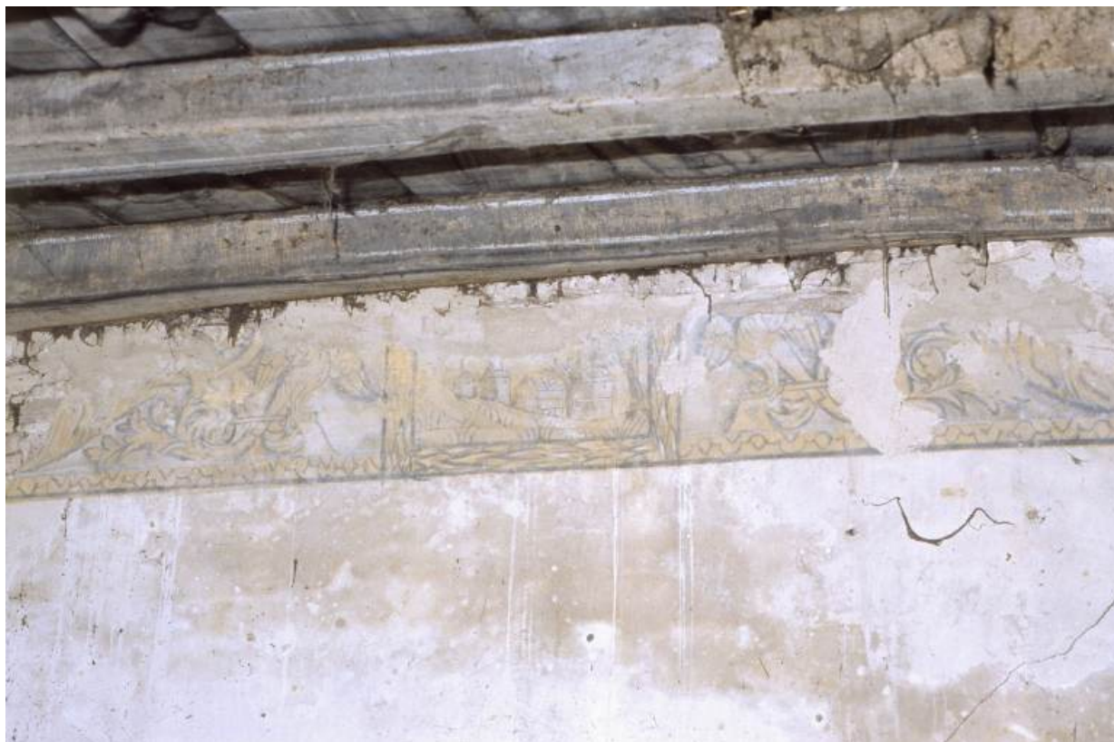
Vue de détail