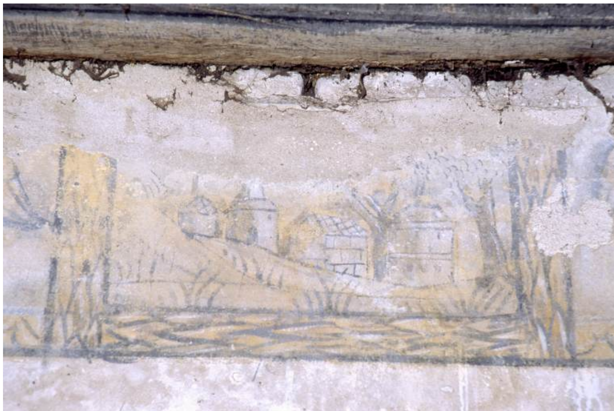
Vue de détail