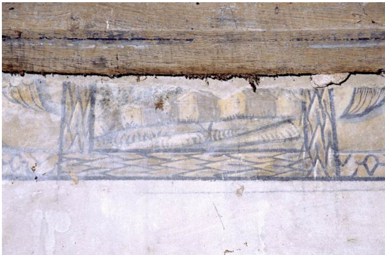
Vue de détail