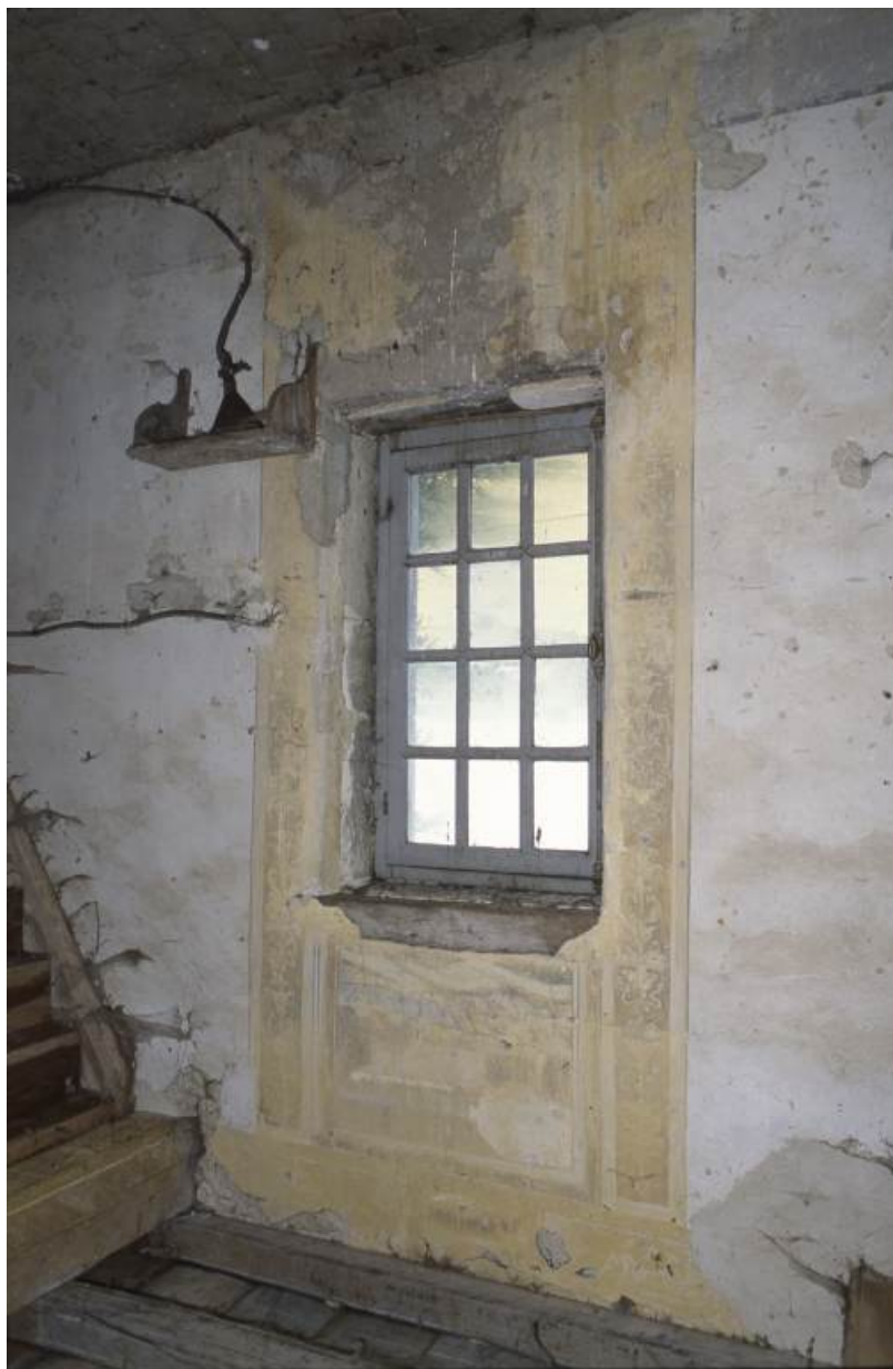
Vue de détail