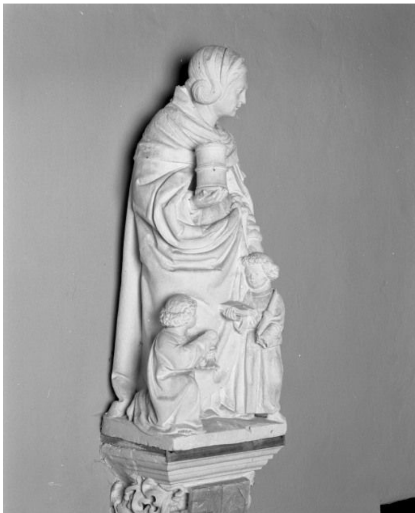
Groupe sculpté : Marie Salomé, de trois-quarts.