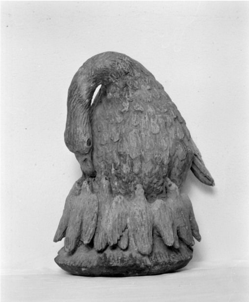
Relief d'applique : Pélican mystique.