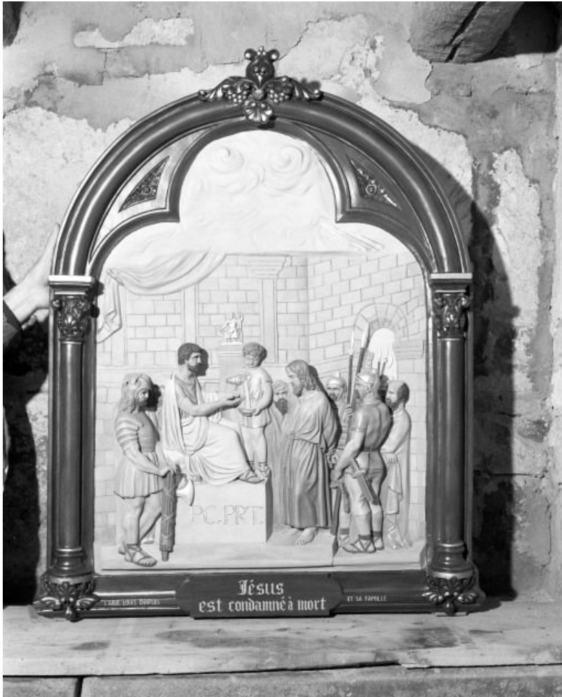
Chemin de croix : Jésus est condamné à mort.