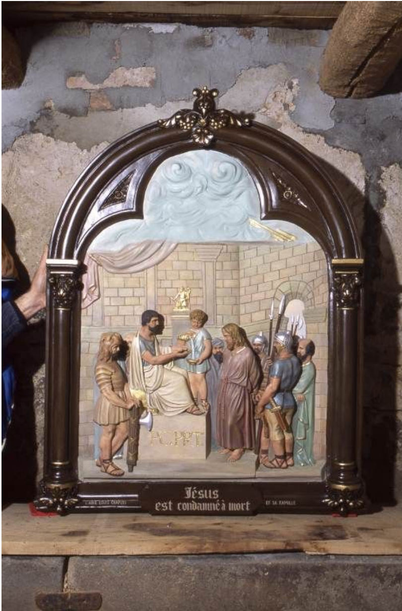
Chemin de croix : Jésus est condamné à mort.