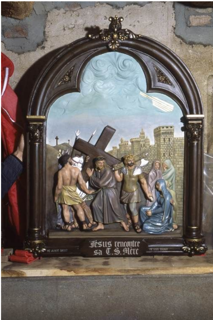
Chemin de croix : Jésus rencontre sa mère.