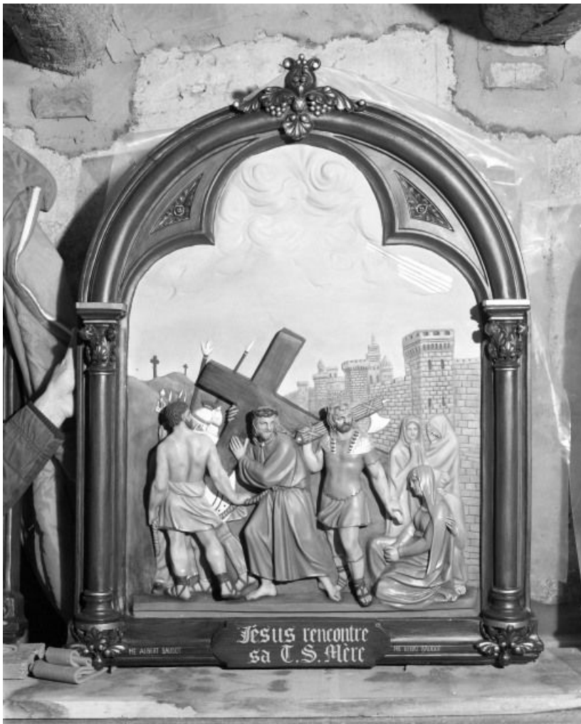
Chemin de croix : Jésus rencontre sa mère.