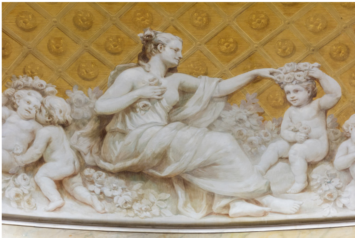
Allégorie du Printemps : détail.