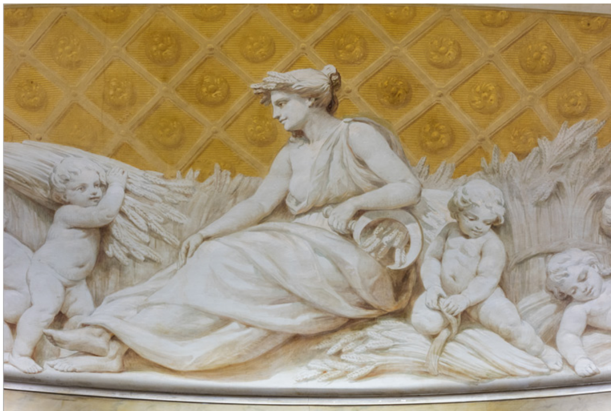
Allégorie de l'Été : détail.