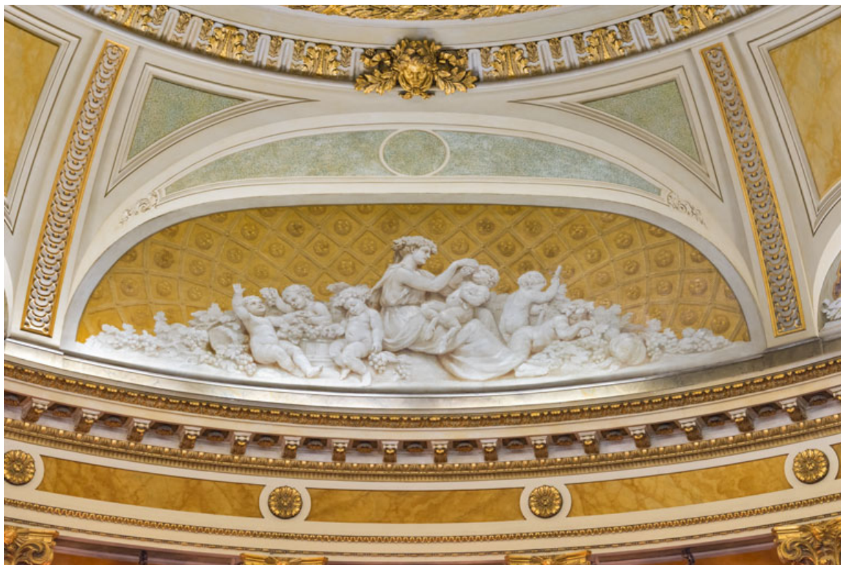
Allégorie de l'Automne (côté jardin).