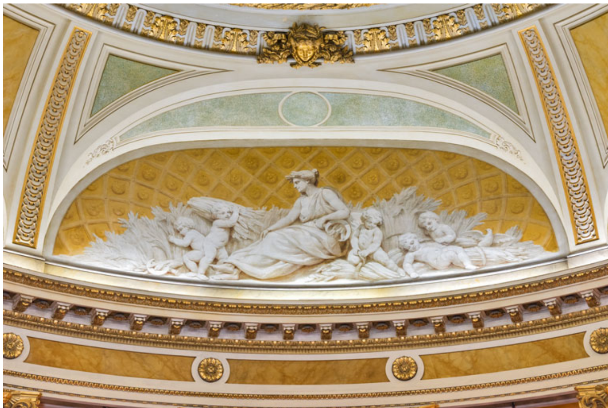
Allégorie de l'Été (en fond de salle).