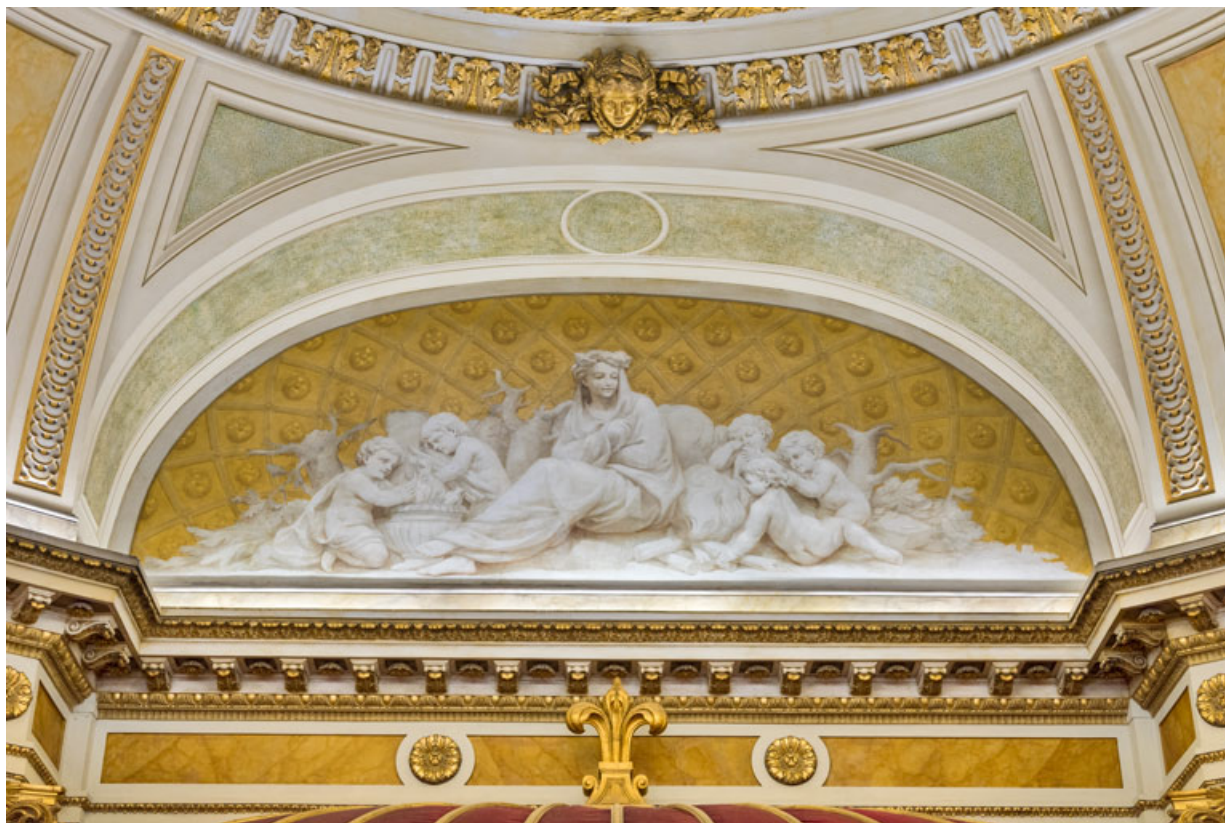
Allégorie de l'Hiver (au-dessus du cadre de scène).