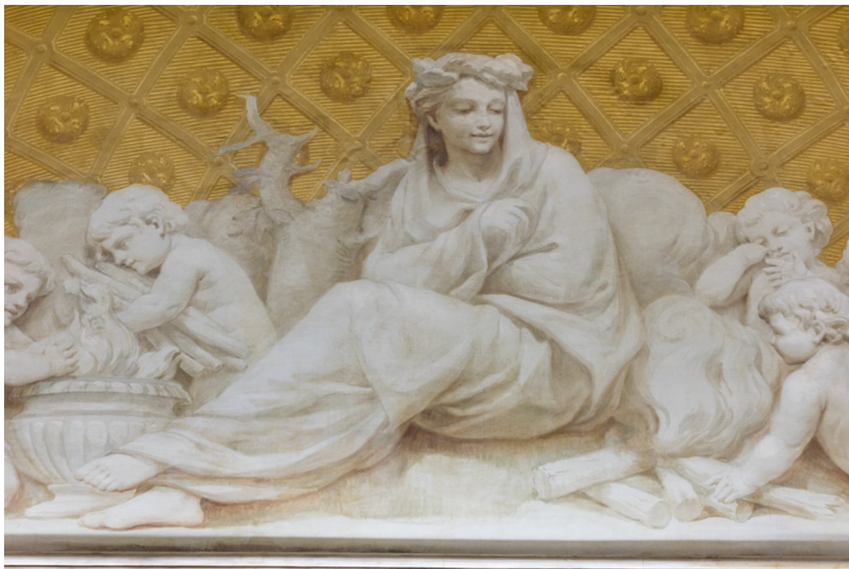
Allégorie de l'Hiver : détail.