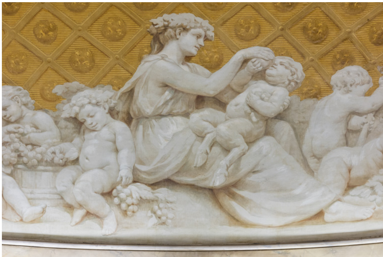
Allégorie de l'Automne : détail (femme faisant boire un jeune faune). 71, Le Creusot rue Jules Guesde