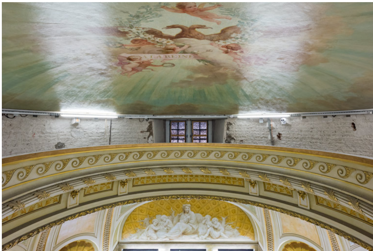
Calotte peinte et ouverture zénithale de la coupole, avec vue sur l'allégorie de l'Hiver.