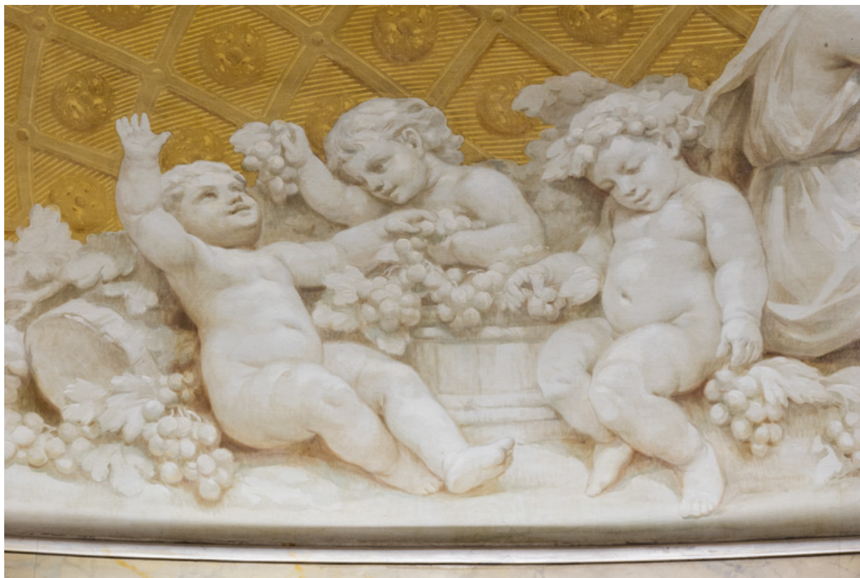
Allégorie de l'Automne : détail (putti et grappes de raisin).