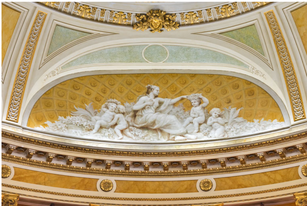
Allégorie du Printemps (côté cour).