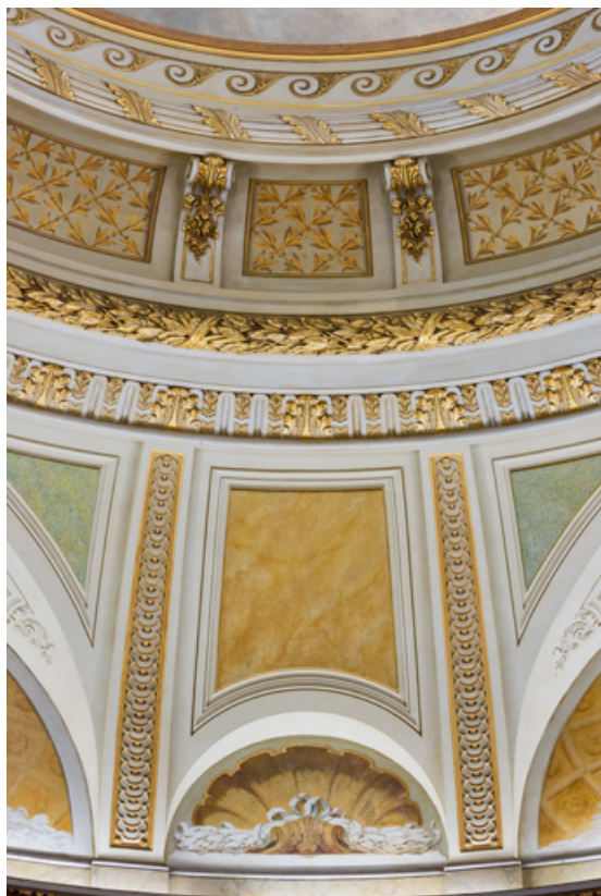
Peinture d'une travée de la coupole.