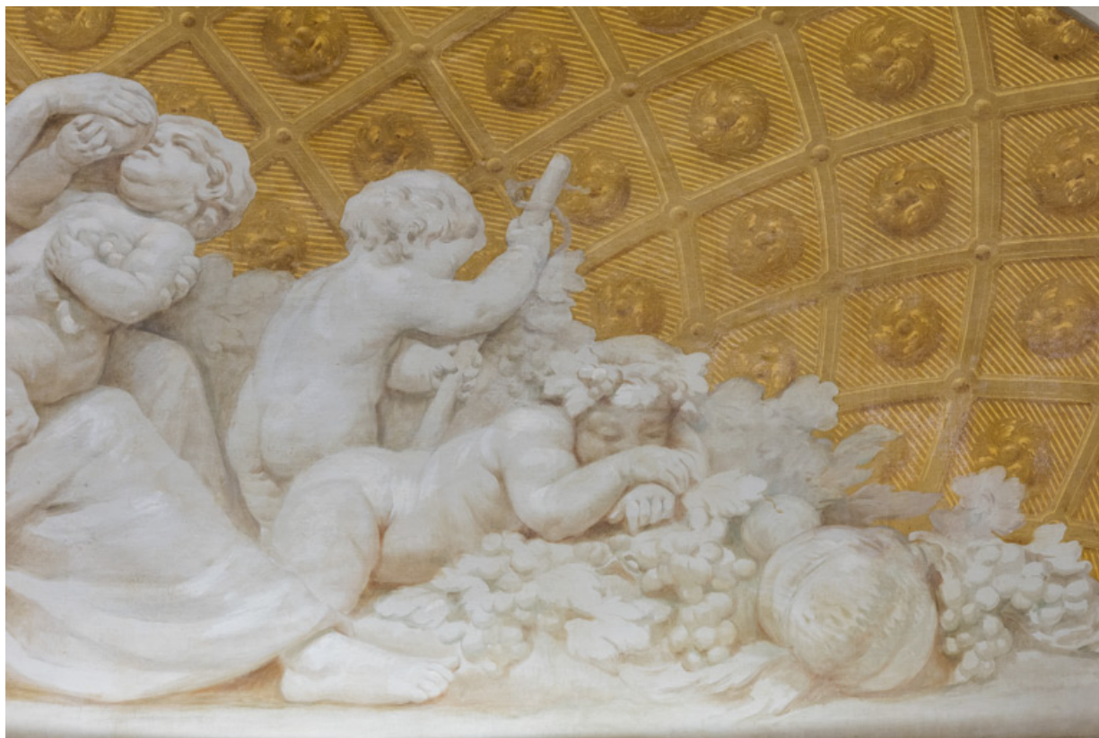
Allégorie de l'Automne : détail (putto endormi et nature morte). 71, Le Creusot rue Jules Guesde