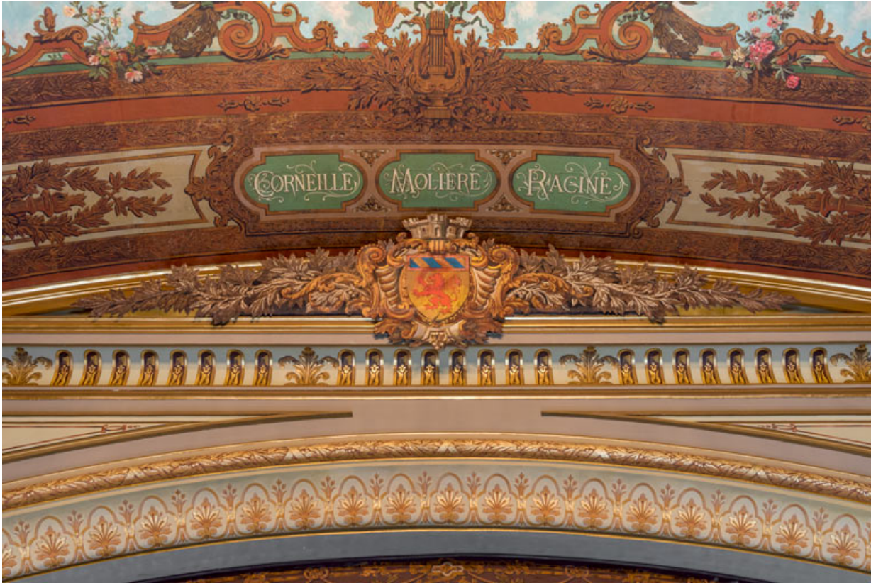
Décor du sommet du cadre de scène et de la partie du plafond qui le jouxte : armoiries d'Autun et nom de trois dramaturges du 17 e siècle.