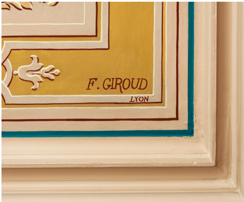
Grand foyer du public (salon d'honneur) : nom du peintre Giroud sur le plafond. 71, Autun place du Champ-de-Mars