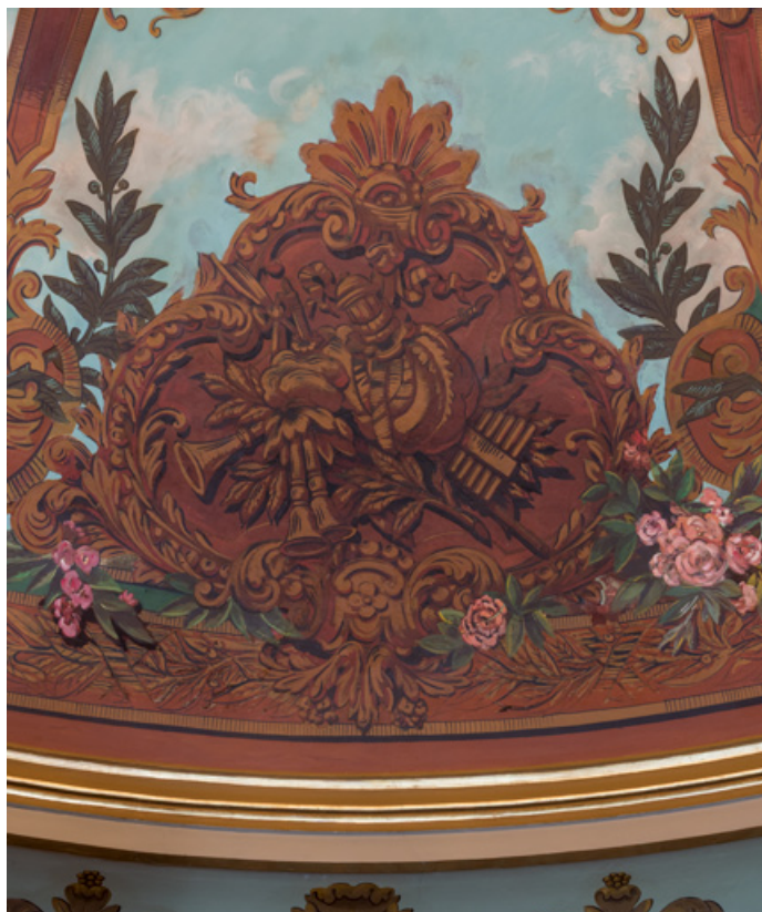
Plafond : cartouche avec trophée d'instruments de musique (cornemuse, flûte de pan). 71, Autun place du Champ-de-Mars