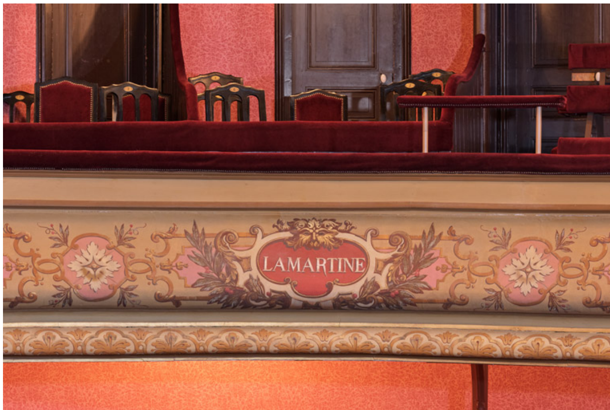
Garde-corps du 1er balcon (Lamartine).