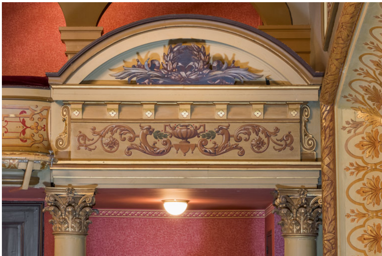
Couronnement de la loge d'avant-scène (côté jardin).