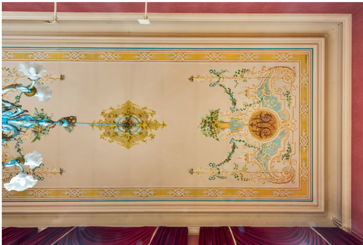
Grand foyer du public (salon d'honneur) : plafond.