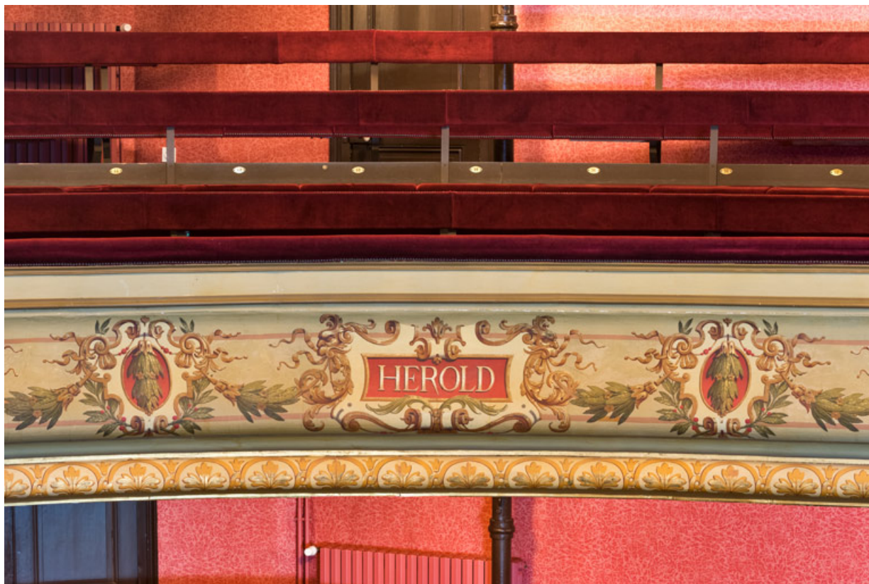
Garde-corps du 2e balcon (Héroid).