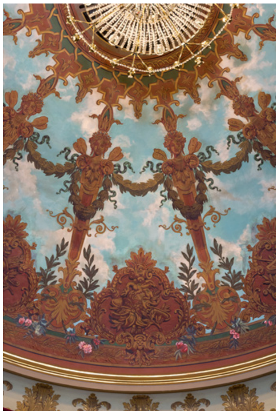
Plafond : détail avec deux cariatides et un cartouche. 71, Autun place du Champ-de-Mars