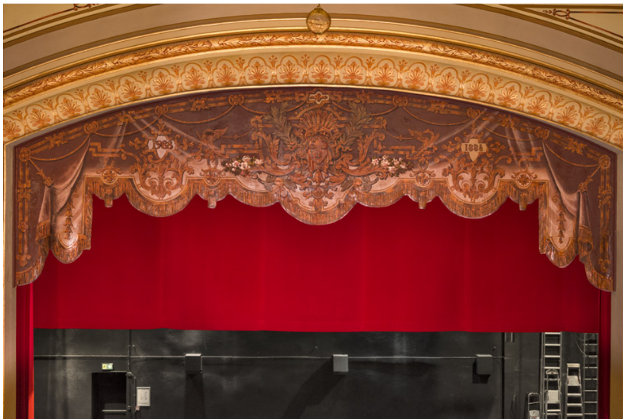
Lambrequin avec représentation d'un rideau à la française.