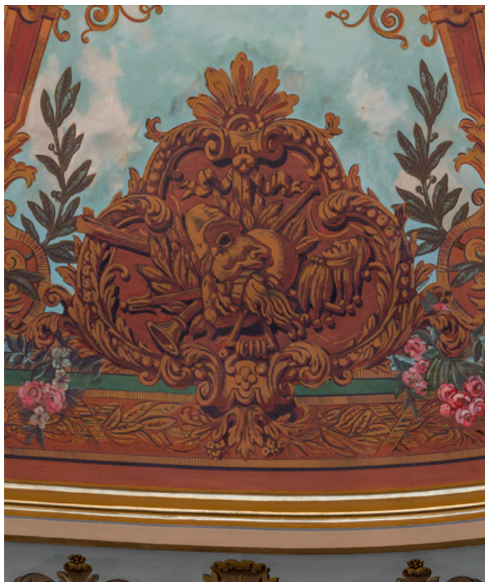
Plafond : cartouche avec masque de la Comédie (flûte à bec, marotte). 71, Autun place du Champ-de-Mars