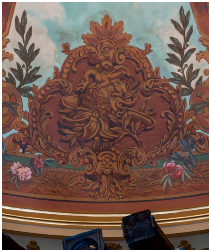
Plafond : cartouche avec trophée guerrier (casque).