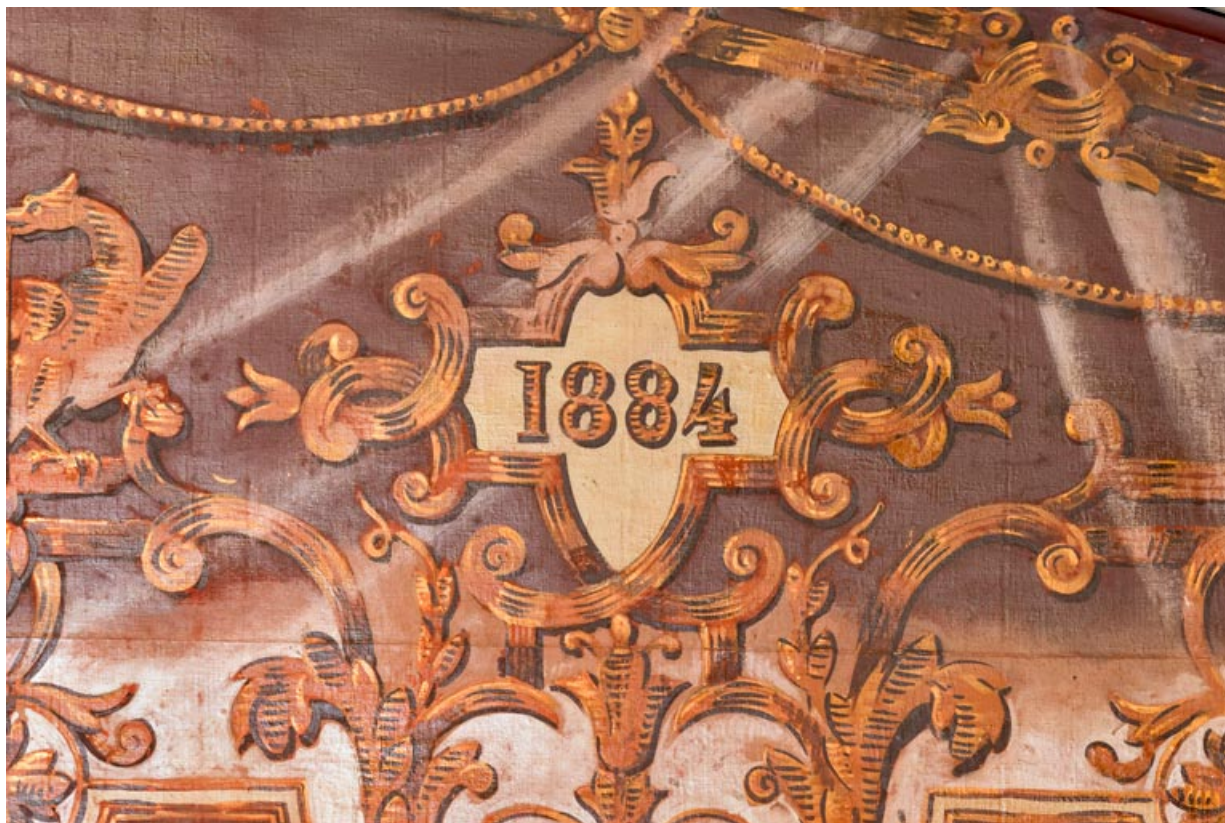
Lambrequin : date 1884 côté cour. 71, Autun place du Champ-de-Mars