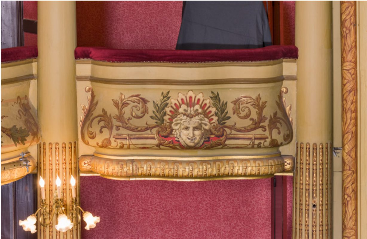
Garde-corps de la loge d'avant-scène (côté jardin) au 2e balcon. 71, Autun place du Champ-de-Mars