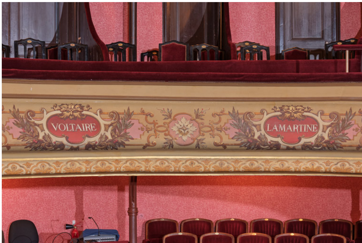
Garde-corps du 1er balcon (Voltaire et Lamartine).