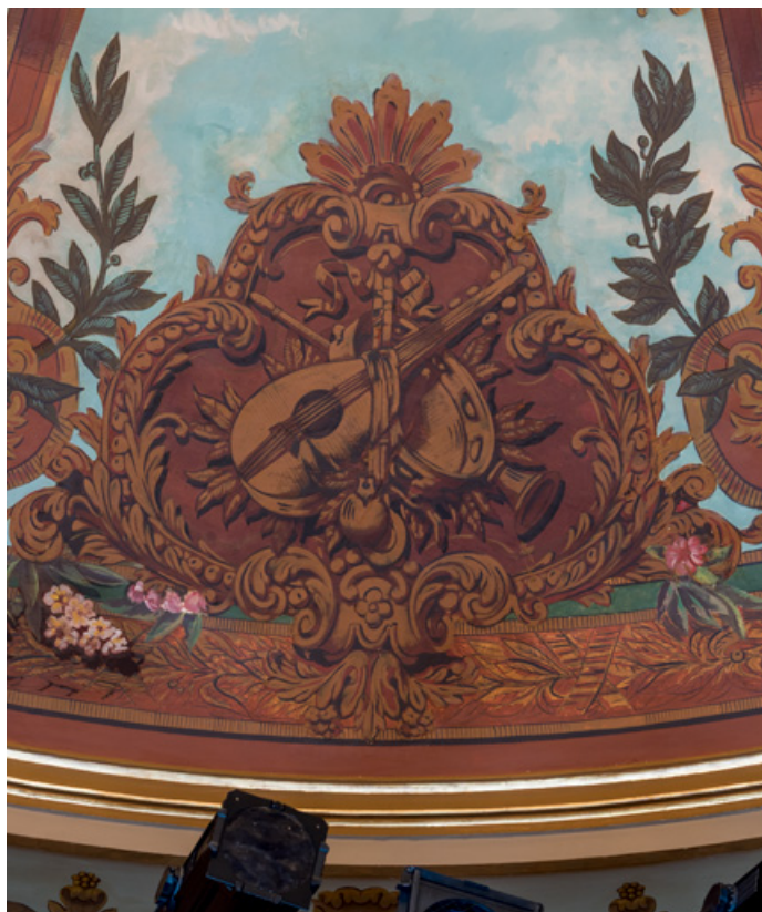
Plafond : cartouche avec trophée d'instruments de musique (mandoline, tambourin de basque, flûte à bec). 71, Autun place du Champ-de-Mars