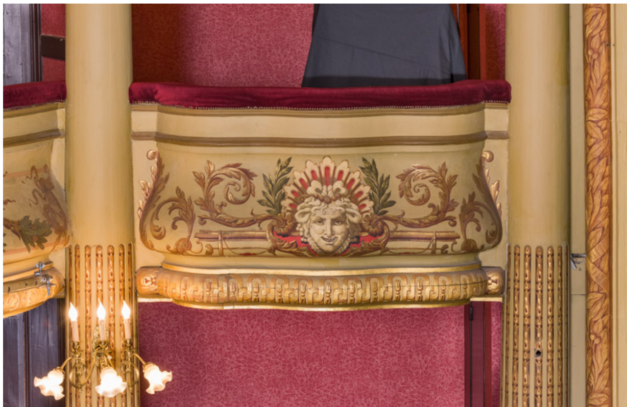
Garde-corps de la loge d'avant-scène (côté jardin) au 2e balcon. 71, Autun place du Champ-de-Mars