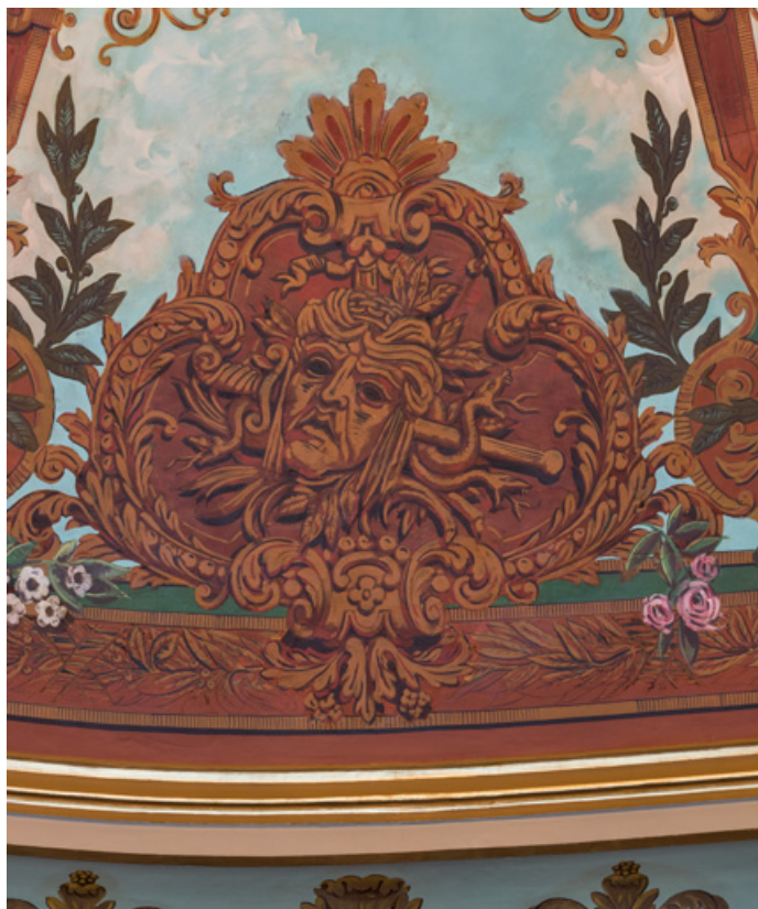
Plafond : cartouche avec masque de la Tragédie (poignard, serpents). 71, Autun place du Champ-de-Mars