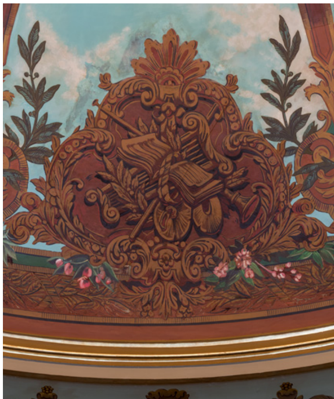
Plafond : cartouche avec trophée d'instruments de musique (harpe, flûte à bec, archet, partition). 71, Autun place du Champ-de-Mars