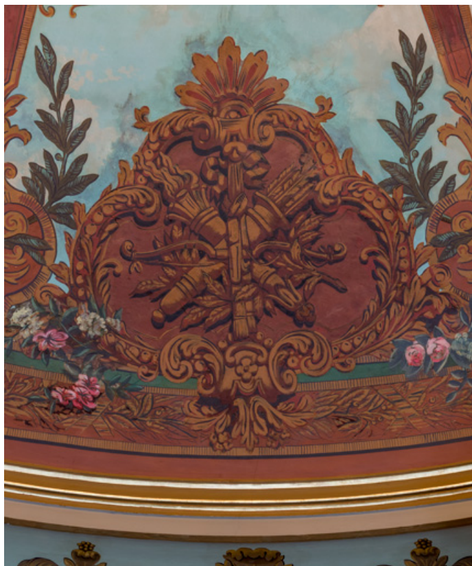
Plafond : cartouche avec trophée guerrier (arc, carquois, torche). 71, Autun place du Champ-de-Mars