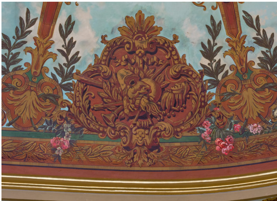
Plafond : cartouche et guirlandes.