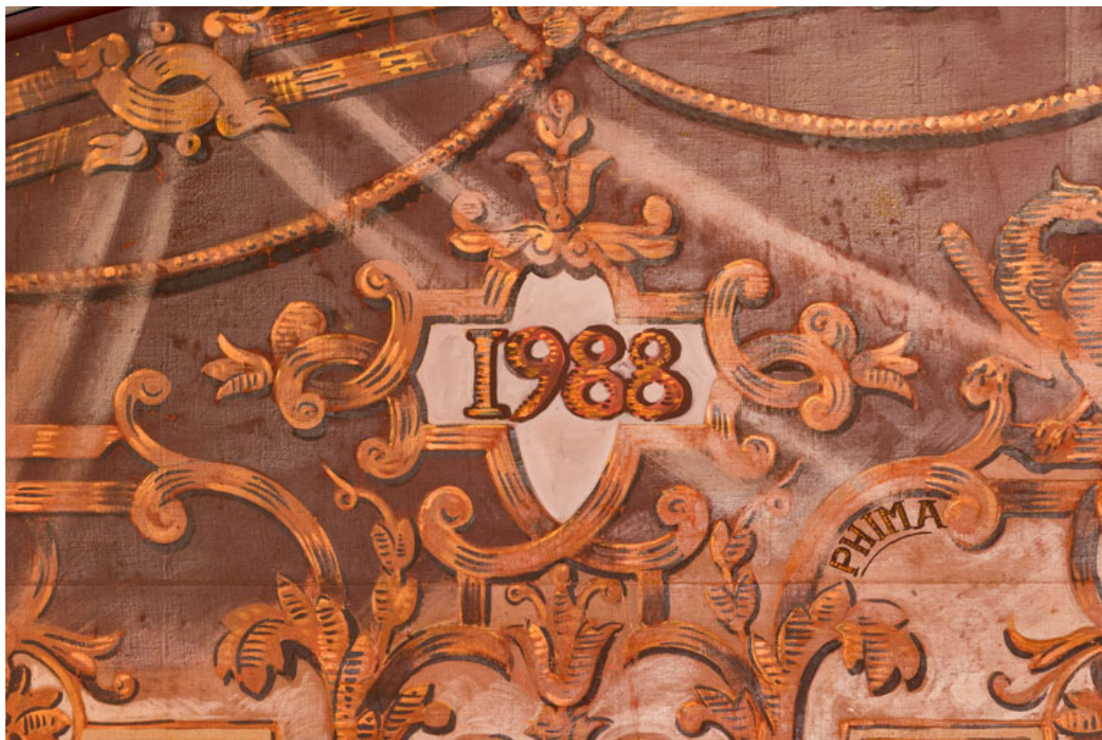
Lambrequin : date 1988 et signature Phima (restaurateur) côté jardin. 71, Autun place du Champ-de-Mars