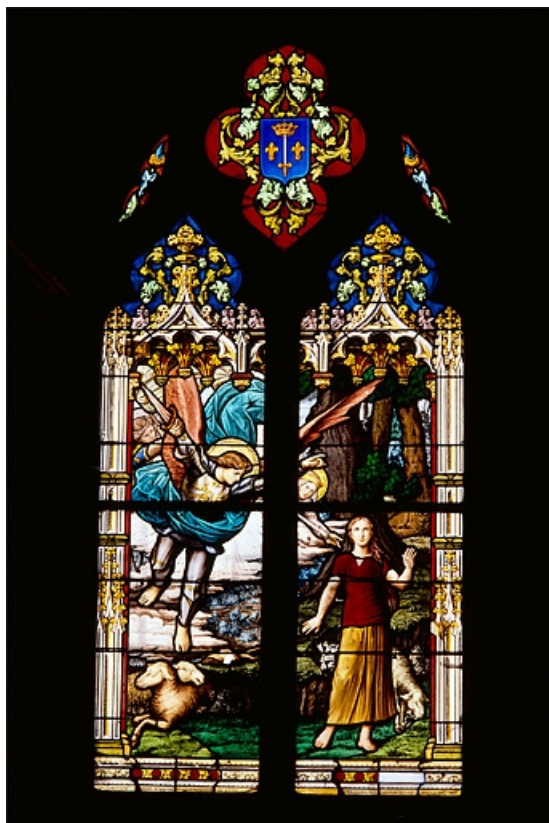
Vue d'ensemble, de face.