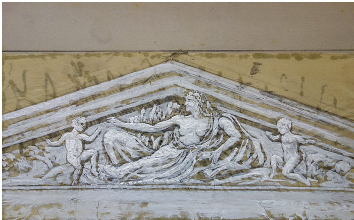
Projet de décor pour le fronton.

70, Luxeuil-les-Bains, 3 rue des Thermes