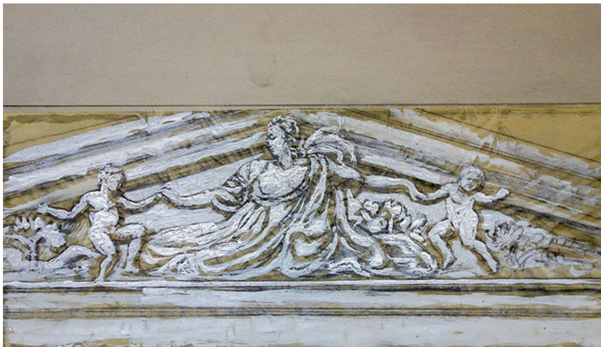
Projet de décor pour le fronton.

70, Luxeuil-les-Bains, 3 rue des Thermes