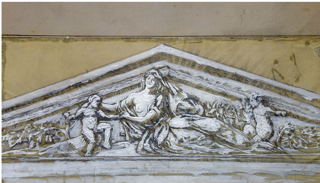
Projet de décor pour le fronton.

70, Luxeuil-les-Bains, 3 rue des Thermes