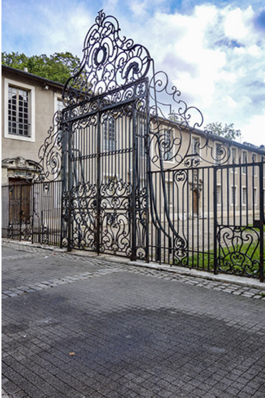
Vue de la grille remontée dans la cour du Musée Lorrain, rue Jacquot, à Nancy. 70, Luxeuil-les-Bains, 3 rue des Thermes