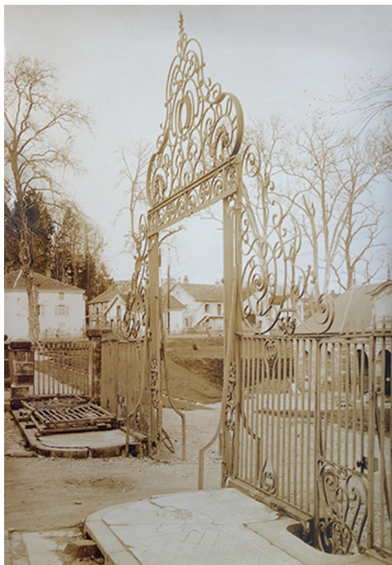
Vue de la grille avant sa dépose.

70, Luxeuil-les-Bains, 3 rue des Thermes