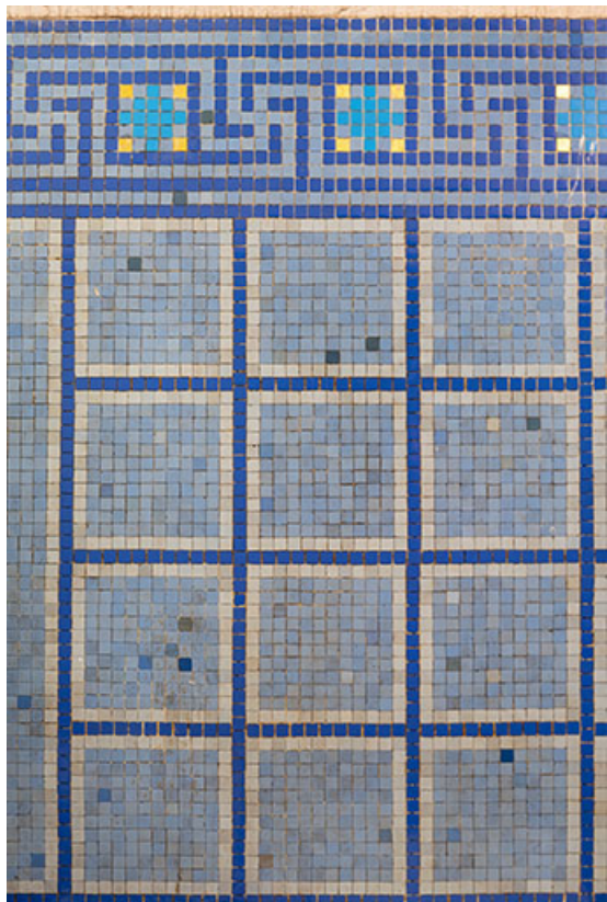
Mur nord de la dernière cabine (actuellement, local de stockage) au rez-de-chaussée de l'aile à l'est de la piscine. 70, Luxeuil-les-Bains, 3 rue des Thermes