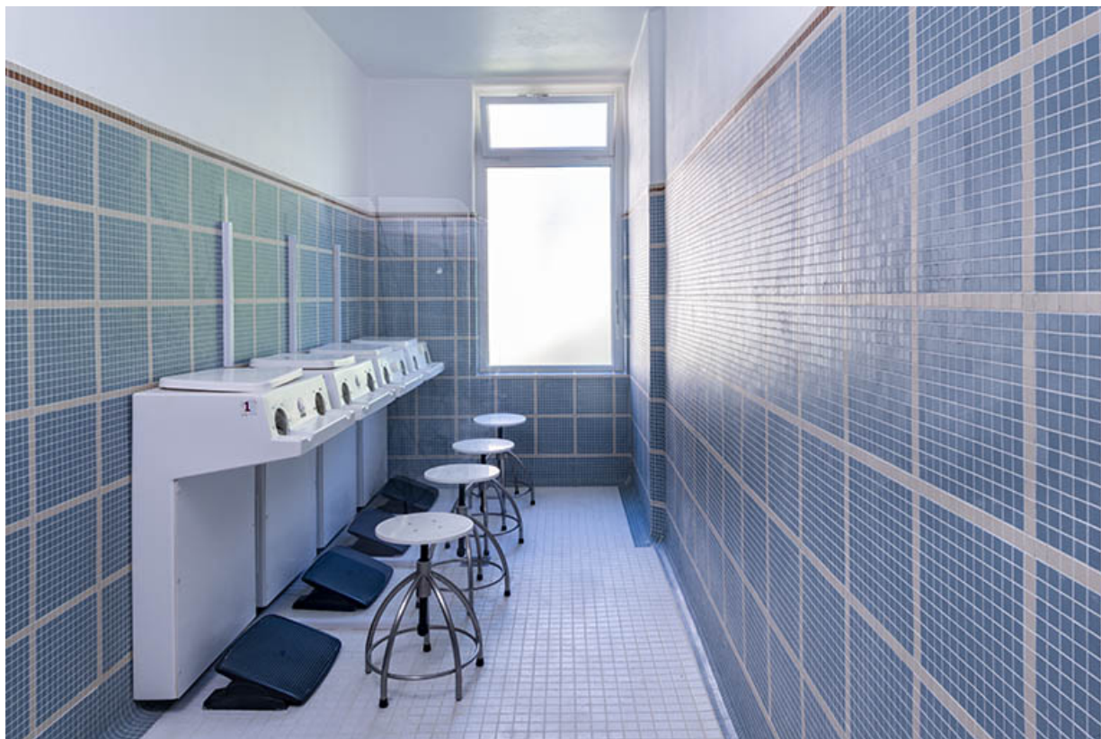
Vue intérieure d'une cabine récemment rénovée au rez-de-chaussée de l'aile à l'est de la piscine.

70, Luxeuil-les-Bains, 3 rue des Thermes