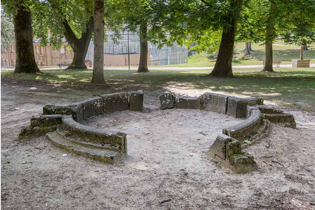
Éléments de la margelle de la piscine déposés dans le parc thermal.

70, Luxeuil-les-Bains, 3 rue des Thermes