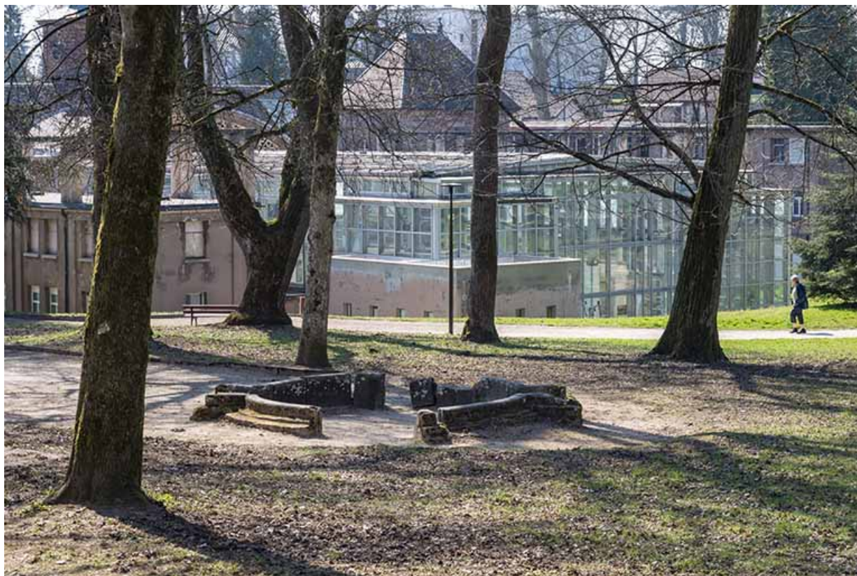
Éléments de la margelle de la piscine déposés dans le parc thermal.

70, Luxeuil-les-Bains, 3 rue des Thermes