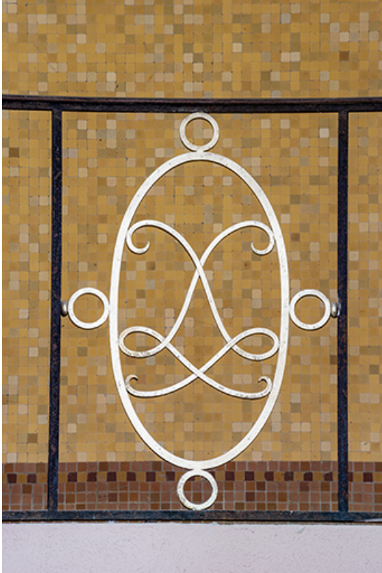
Médaillon ovale au chiffre de Luxeuil du garde-corps de la tribune de la piscine à l'emplacement de l'ancien Bain des Capucins. 70, Luxeuil-les-Bains, 3 rue des Thermes