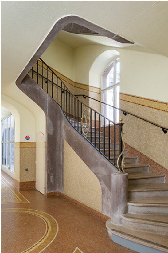
Escalier à garde-corps métallique orné d'un médaillon ovale au chiffre de Luxeuil. 70, Luxeuil-les-Bains, 3 rue des Thermes