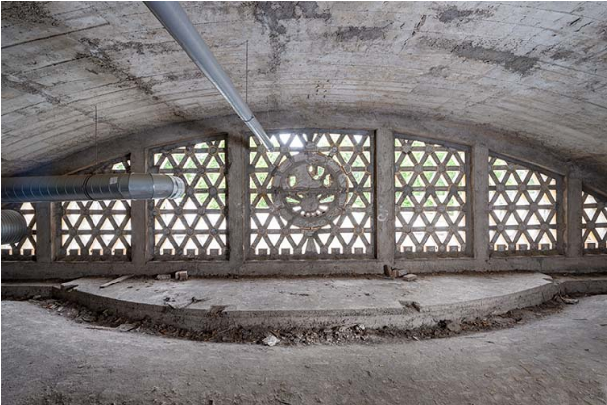
Vue de face de la claustra depuis les combles.

70, Luxeuil-les-Bains, 3 rue des Thermes