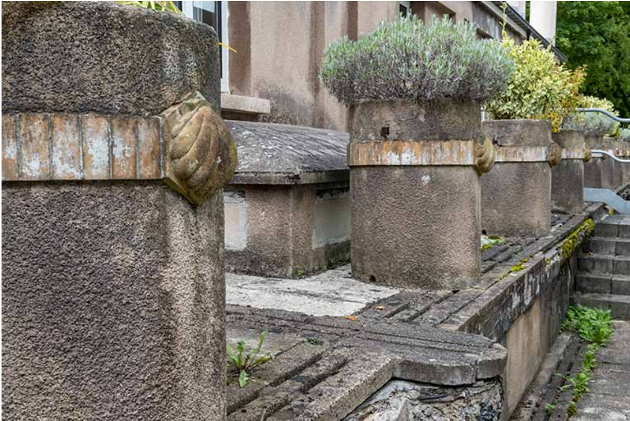
Appliques sur les pots à plantes de l'aile ouest de la piscine : coquillages.

70, Luxeuil-les-Bains, 3 rue des Thermes