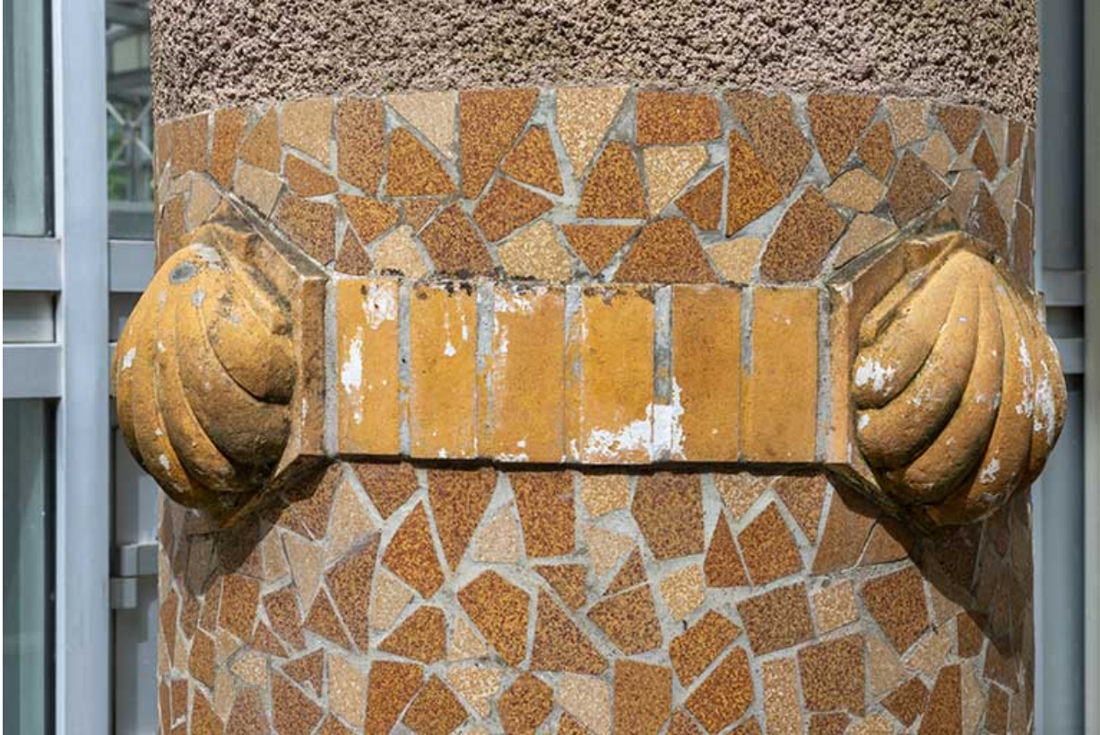
Appliques sur les colonnes portant la statue d'Hygie : coquillages.

70, Luxeuil-les-Bains, 3 rue des Thermes