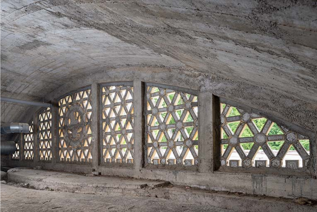
Vue de trois-quarts de la claustra depuis les combles.

70, Luxeuil-les-Bains, 3 rue des Thermes