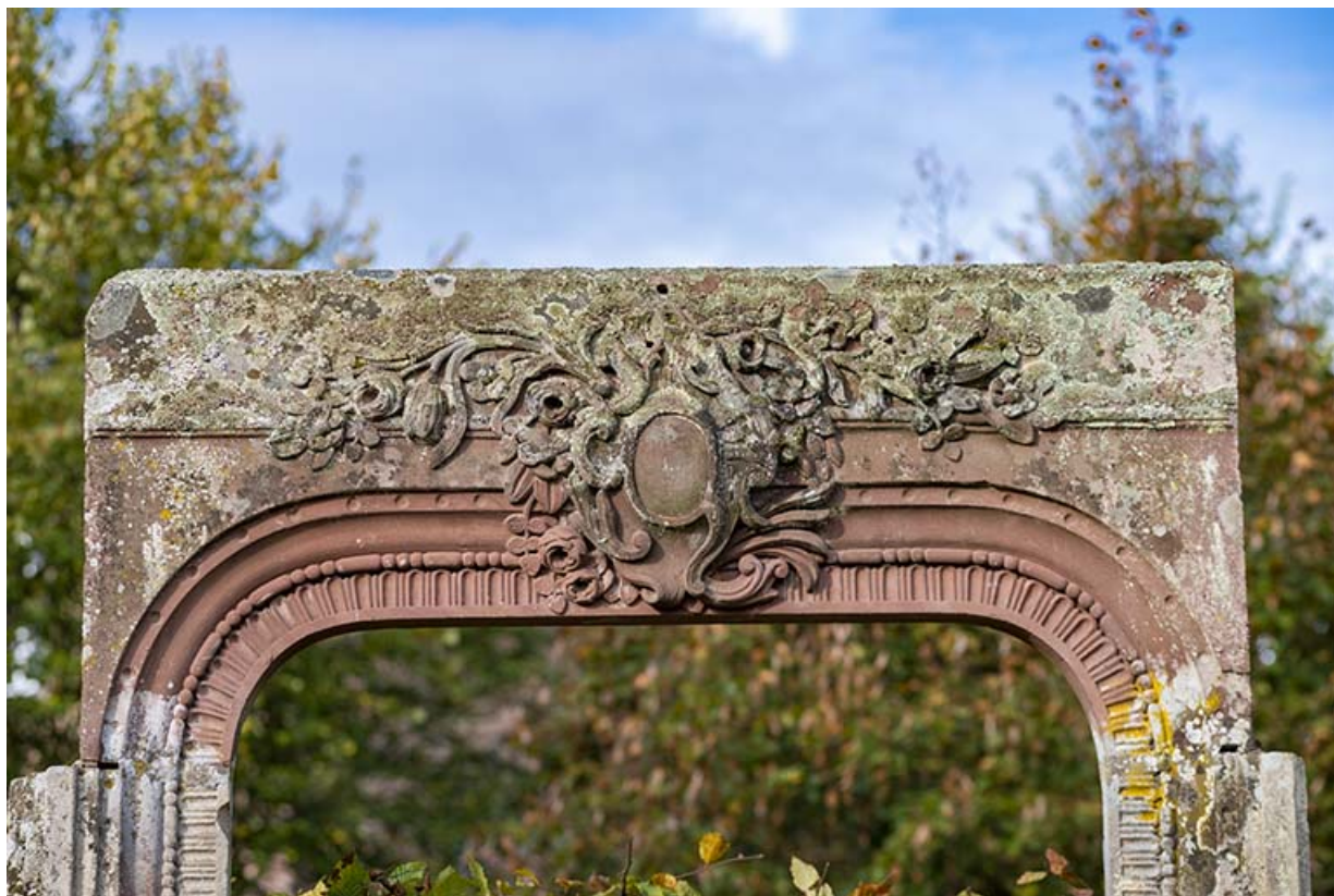
Encadrement de porte, détail du décor sculpté.

70, Luxeuil-les-Bains, 3 rue des Thermes