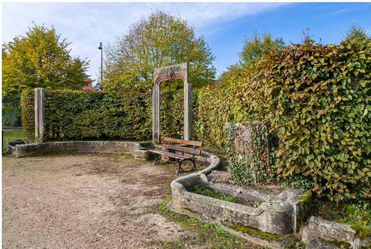
Vestiges (encadrement de porte, trumeaux et bassins) disposés en exèdre.

70, Luxeuil-les-Bains, 3 rue des Thermes