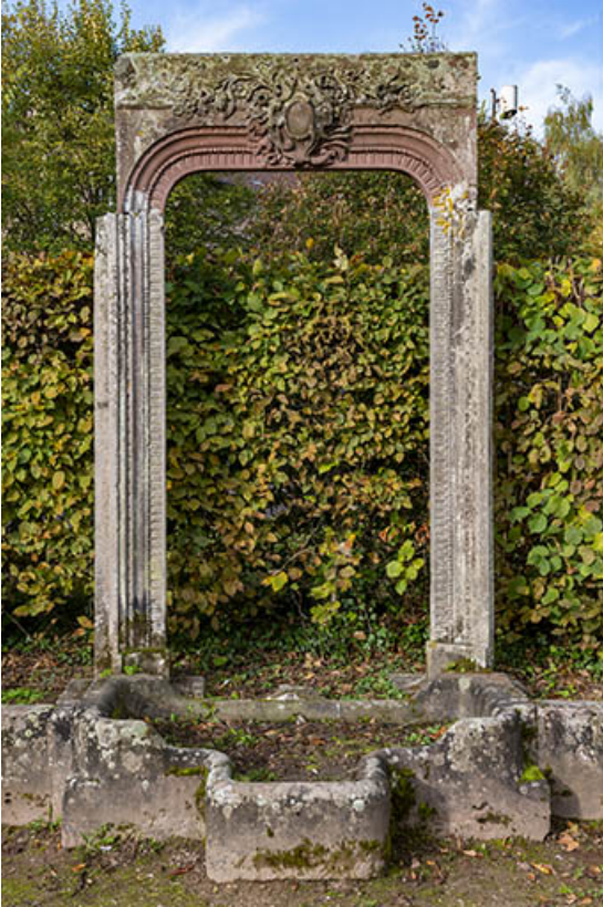
Encadrement de porte, vue de face.

70, Luxeuil-les-Bains, 3 rue des Thermes