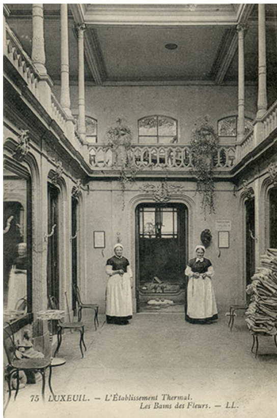
Vue intérieure du Bain des Fleurs détruit à la fin des années 1930.

70, Luxeuil-les-Bains, 3 rue des Thermes