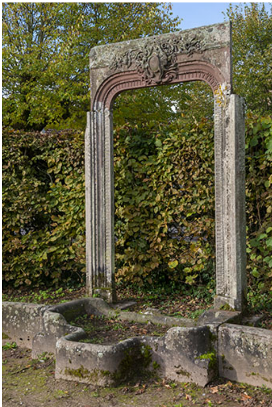
Encadrement de porte, vue de trois-quarts.

70, Luxeuil-les-Bains, 3 rue des Thermes