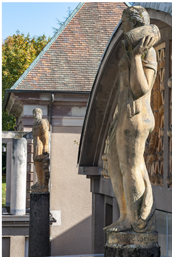
Vue de la statue depuis l'aile ouest de la piscine.

70, Luxeuil-les-Bains, 3 rue des Thermes