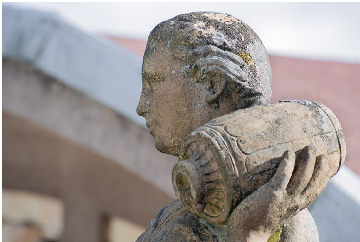
Vue de la statue depuis l'aile ouest de la piscine, détail.

70, Luxeuil-les-Bains, 3 rue des Thermes