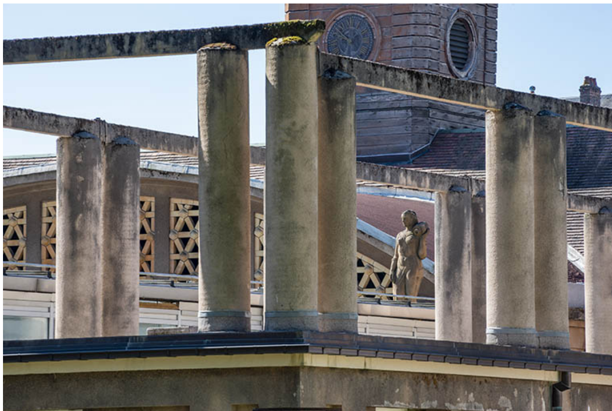
Situation de la statue, vue à travers la pergola de la terrasse de l'aile ouest de la piscine. 70, Luxeuil-les-Bains, 3 rue des Thermes