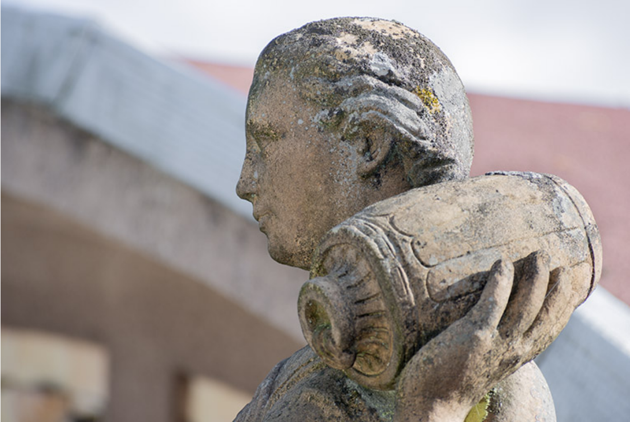
Vue de la statue depuis l'aile ouest de la piscine, détail.

70, Luxeuil-les-Bains, 3 rue des Thermes