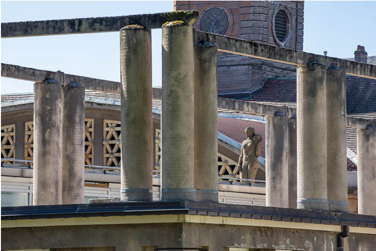
Situation de la statue, vue à travers la pergola de la terrasse de l'aile ouest de la piscine.

70, Luxeuil-les-Bains, 3 rue des Thermes