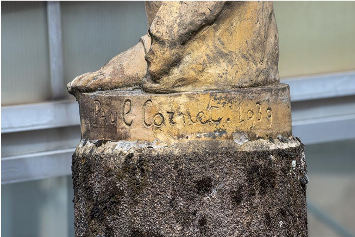
Signature du sculpteur et date sur la plinthe : "Paul Cornet 1939".

70, Luxeuil-les-Bains, 3 rue des Thermes