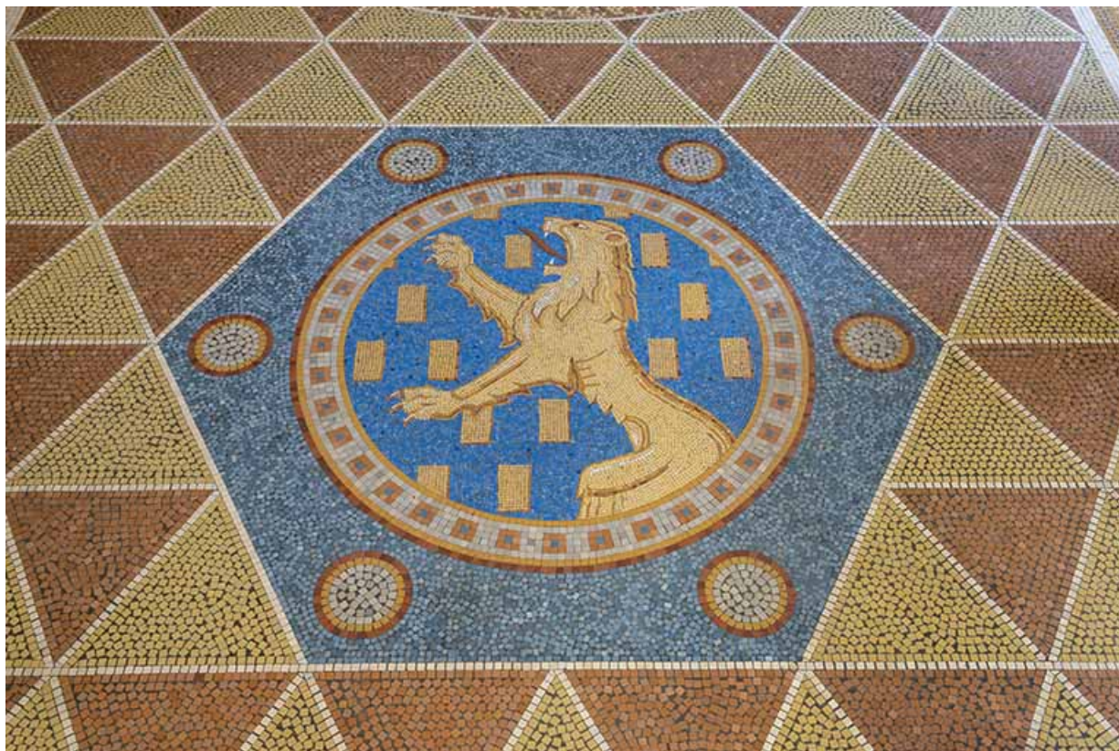
Médailon orné des armes de Franche-Comté : "D'azur semé de billettes d'or, au lion d'or, armé et lampassé de gueules". 70, Luxeuil-les-Bains, 3 rue des Thermes