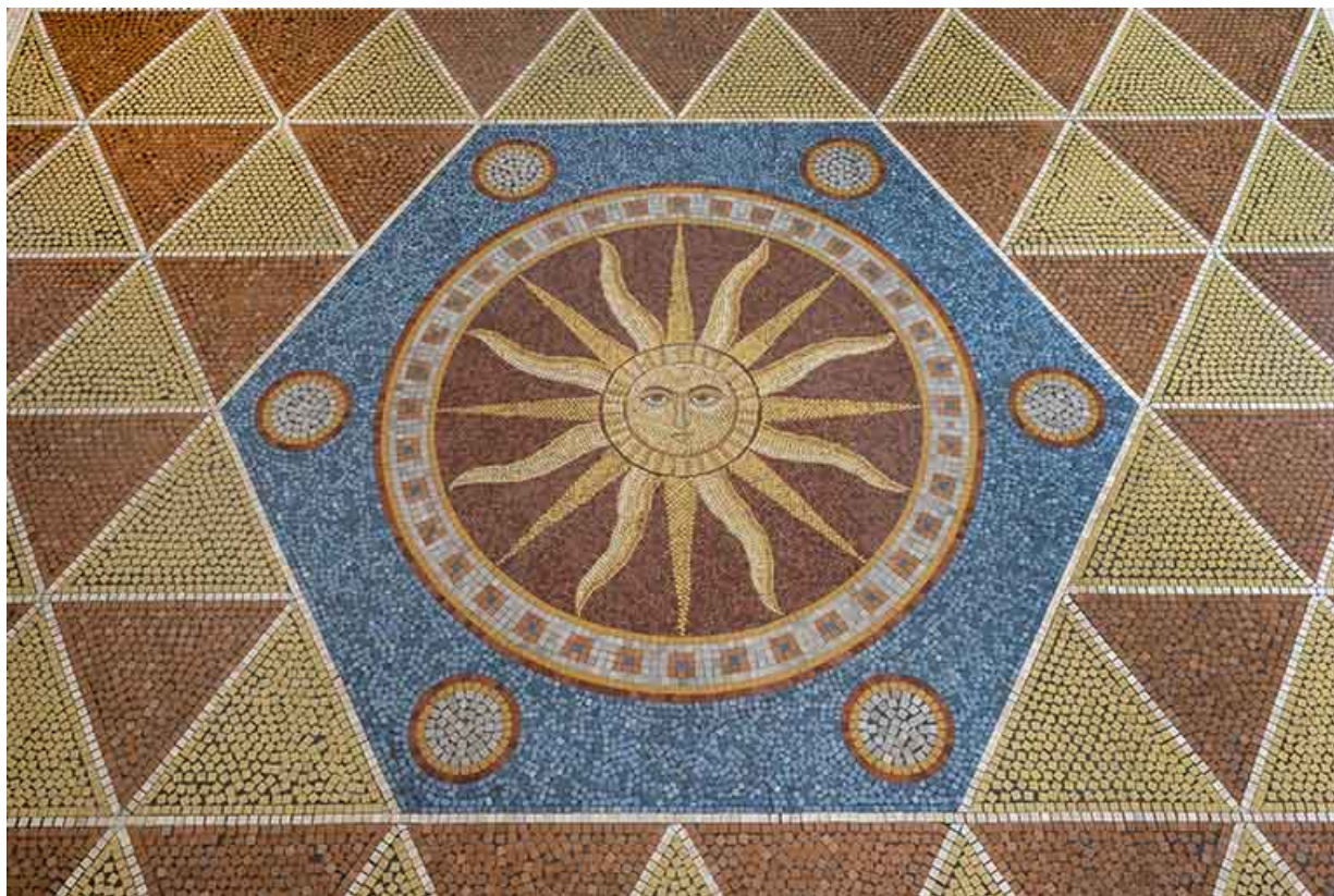
Médailon orné des armes de Luxeuil : "De gueules au soleil d'or".

70, Luxeuil-les-Bains, 3 rue des Thermes