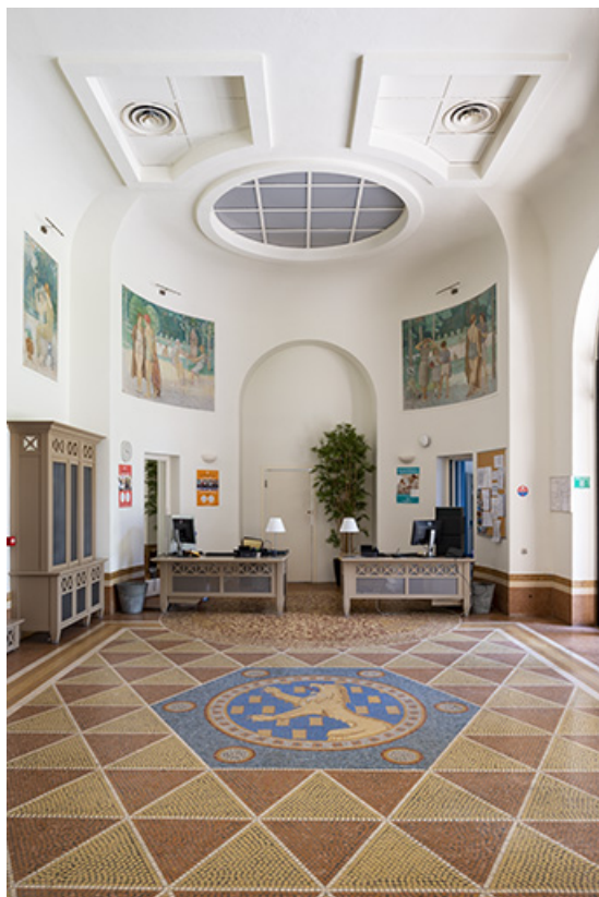
Vue du vestibule en direction de l'est.

70, Luxeuil-les-Bains, 3 rue des Thermes