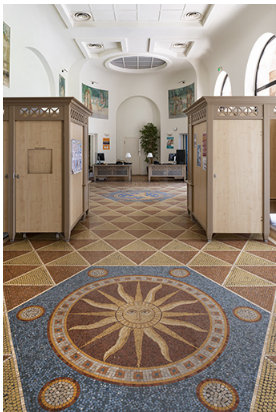
Vue du vestibule en direction de l'est.

70, Luxeuil-les-Bains, 3 rue des Thermes