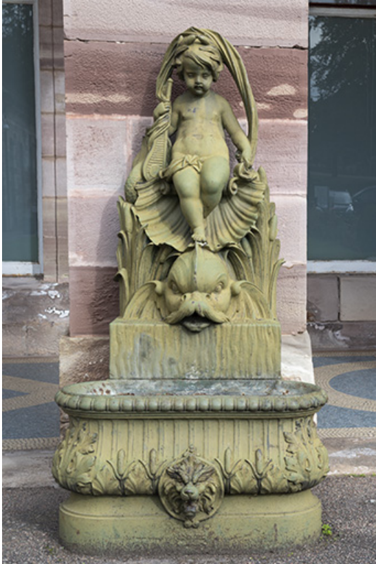
Fontaine du côté gauche (ouest) : vue d'ensemble, de face.

70, Luxeuil-les-Bains, 3 rue des Thermes