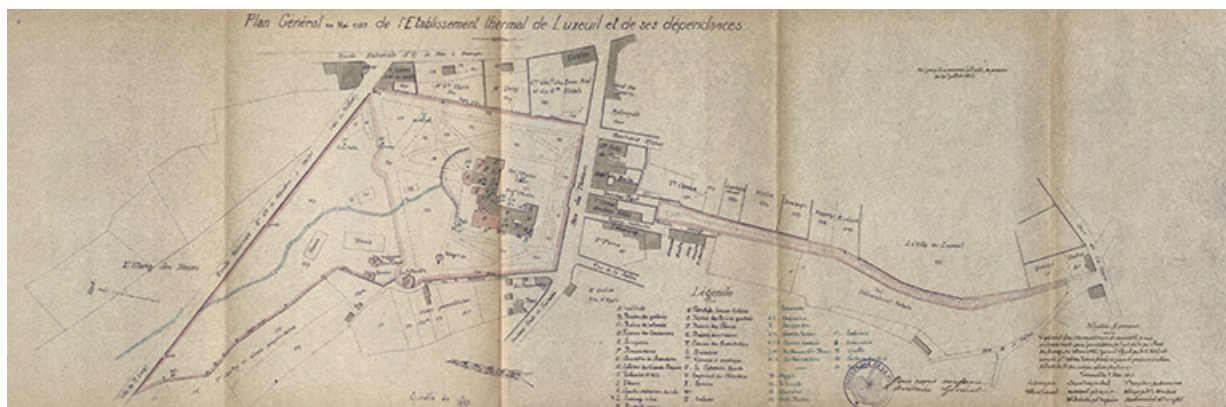
Plan de l'établissement thermal localisant la "Fontaine Martin" dans la cour en 1922.

70, Luxeuil-les-Bains, 3 rue des Thermes