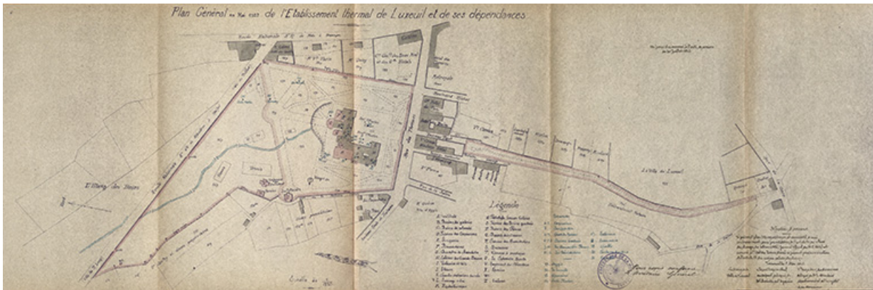
Plan de l'établissement thermal localisant la "Fontaine Martin" dans la cour en 1922.

70, Luxeuil-les-Bains, 3 rue des Thermes