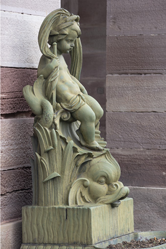
Fontaine du côté droit (est) : vue de la partie supérieure.

70, Luxeuil-les-Bains, 3 rue des Thermes