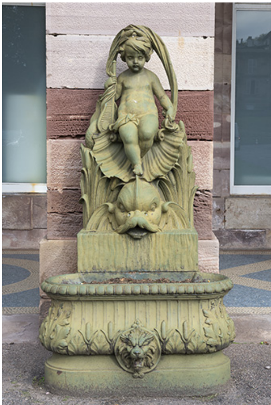
Fontaine du côté droit (est) : vue d'ensemble, de face.

70, Luxeuil-les-Bains, 3 rue des Thermes