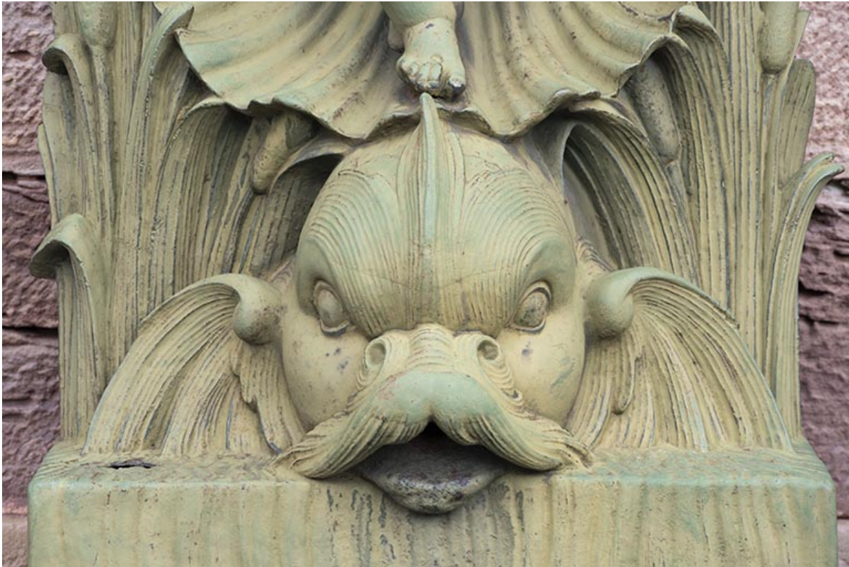
Fontaine du côté droit (est) : vue de la partie supérieure, détail du dauphin.

70, Luxeuil-les-Bains, 3 rue des Thermes