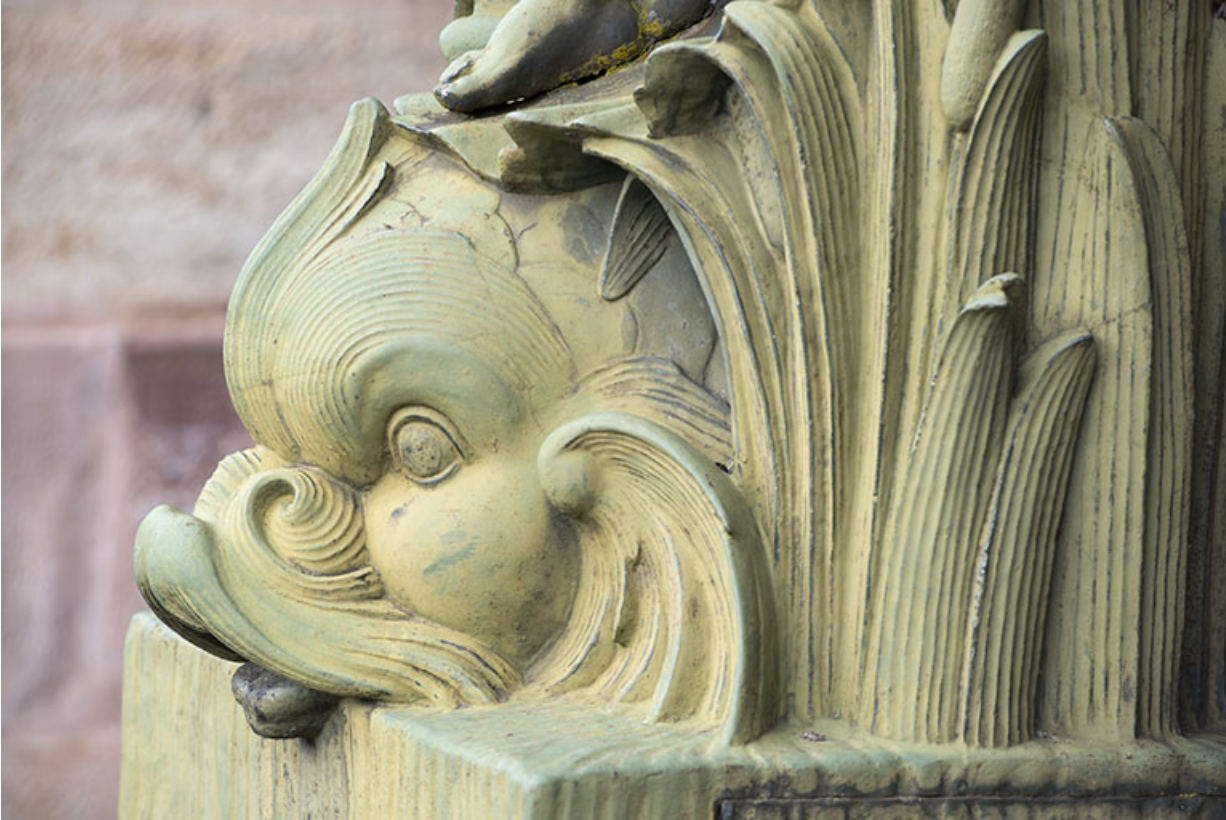
Fontaine du côté droit (est) : vue de la partie supérieure, détail du dauphin.

70, Luxeuil-les-Bains, 3 rue des Thermes