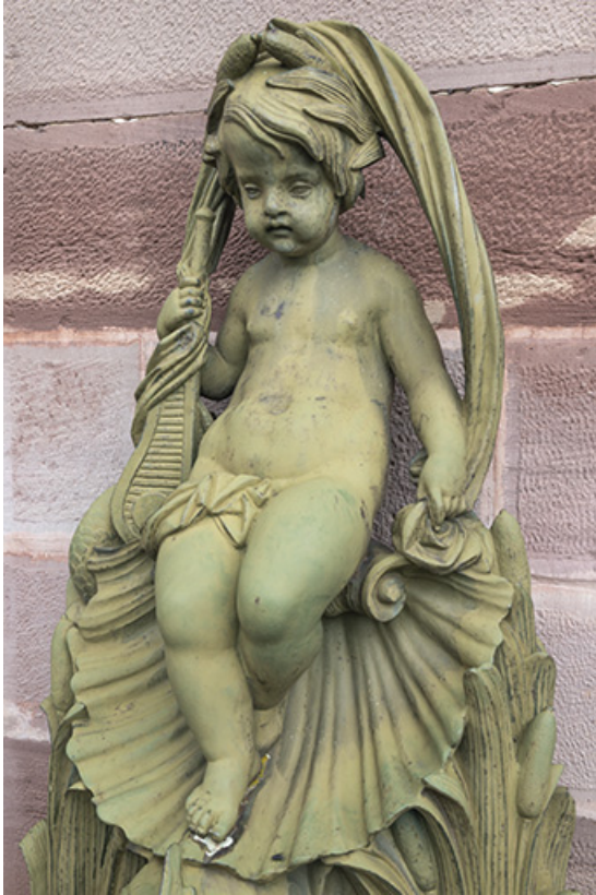
Fontaine du côté gauche (ouest) : vue de la partie supérieure.

70, Luxeuil-les-Bains, 3 rue des Thermes