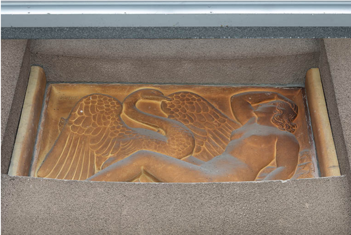
Léda et le cygne (relief n°3).

70, Luxeuil-les-Bains, 3 rue des Thermes