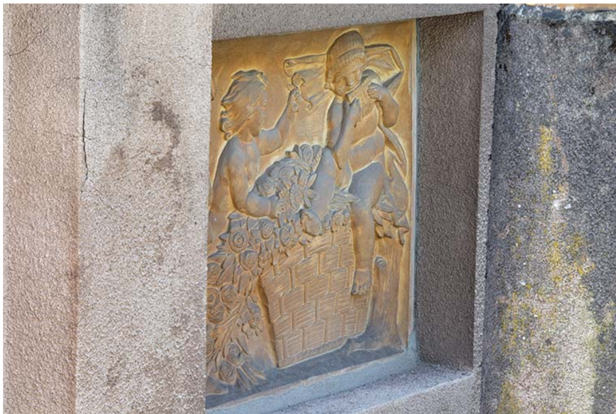
Enfants à la flûte (relief n°1).

70, Luxeuil-les-Bains, 3 rue des Thermes