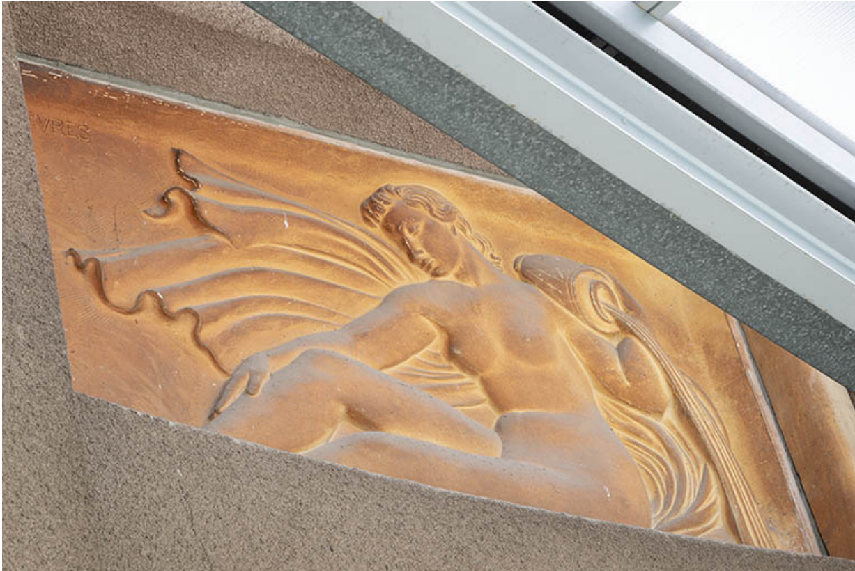
Femme assise, amphore sur l'épaule (relief n°4).

70, Luxeuil-les-Bains, 3 rue des Thermes