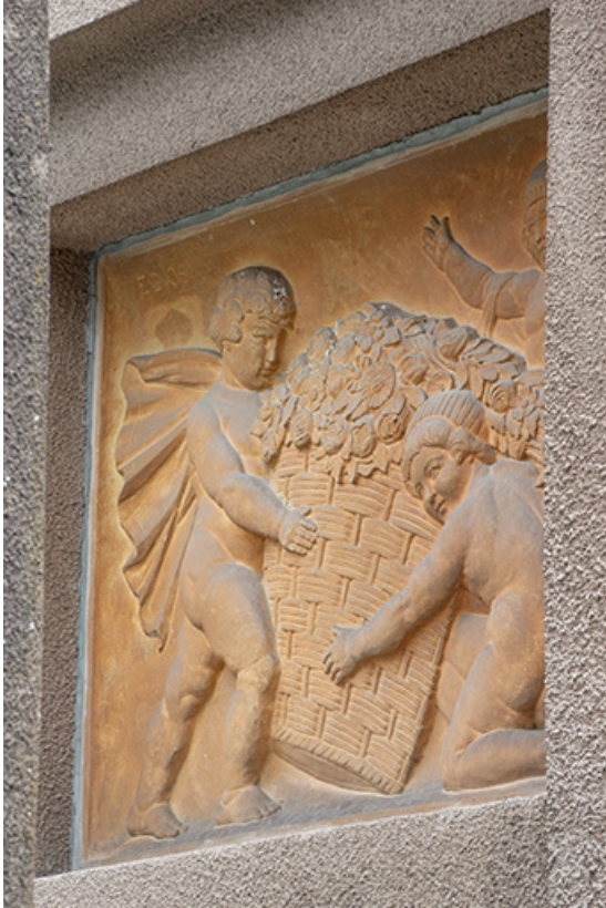
Enfants à la corbeille (relief n°5).

70, Luxeuil-les-Bains, 3 rue des Thermes