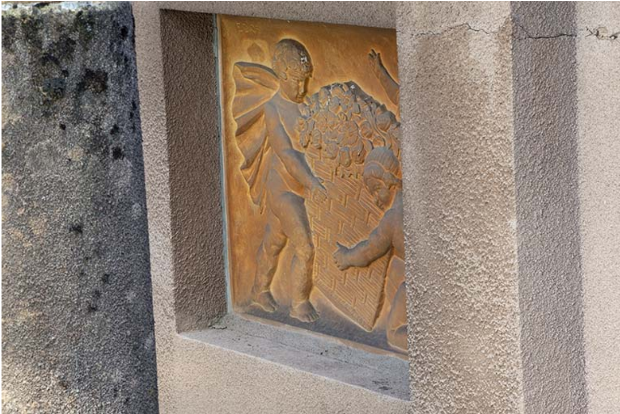
Enfants à la corbeille (relief n°5).

70, Luxeuil-les-Bains, 3 rue des Thermes