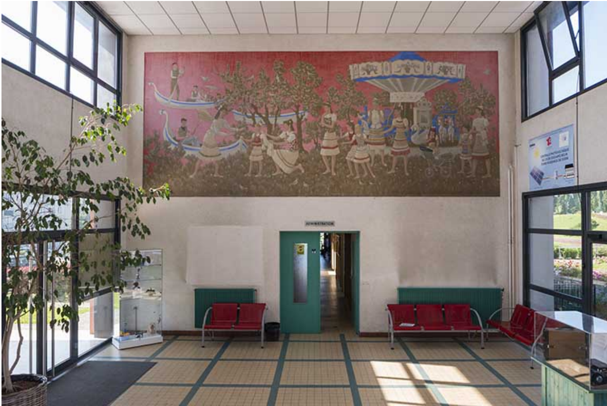
L'oeuvre dans son contexte.