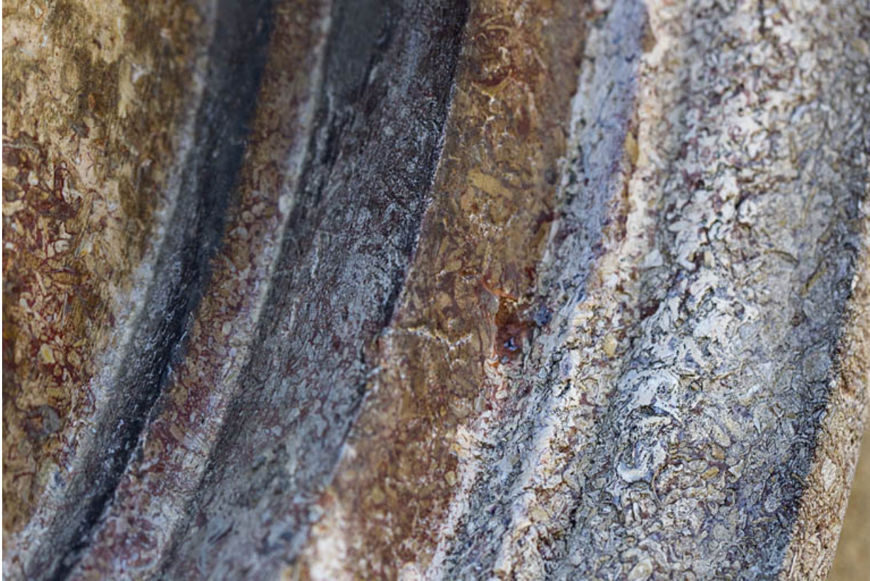
Néron : détail de la moulure du médaillon.