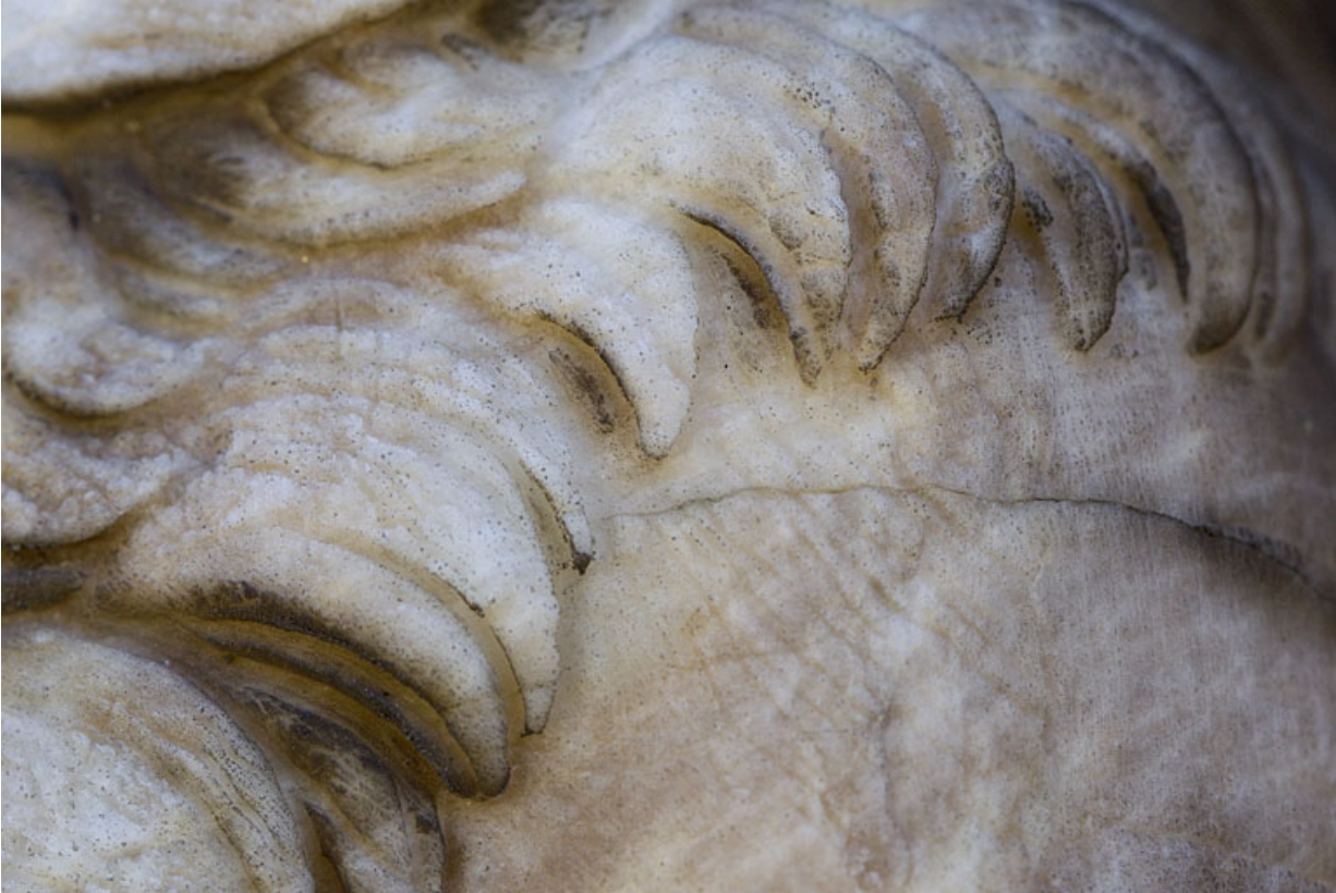
Auguste : détail des cheveux.