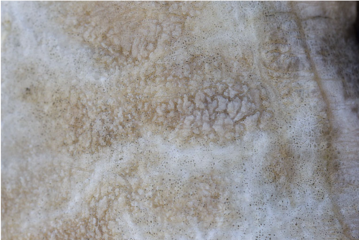
Auguste : altération de l'albâtre.