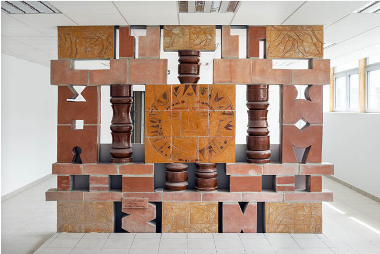
Vue d'ensemble face A.