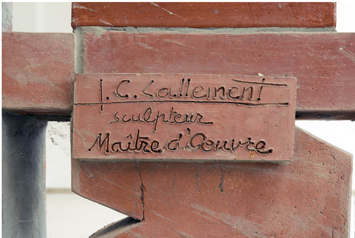
Détail : signature du sculpteur.