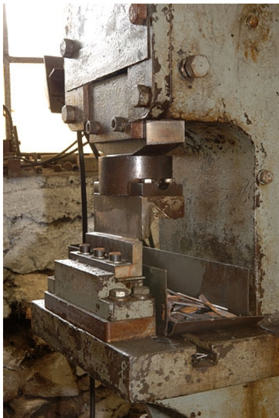
Détail de la cisaille gauche.