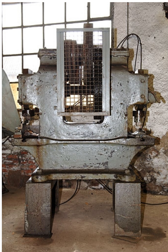
Vue de face.