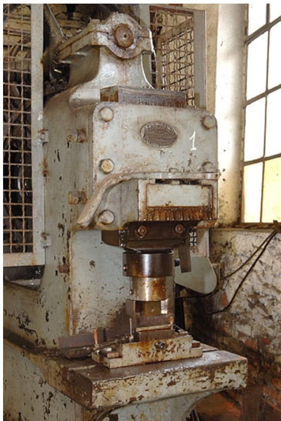
Détail de la cisaille droite.