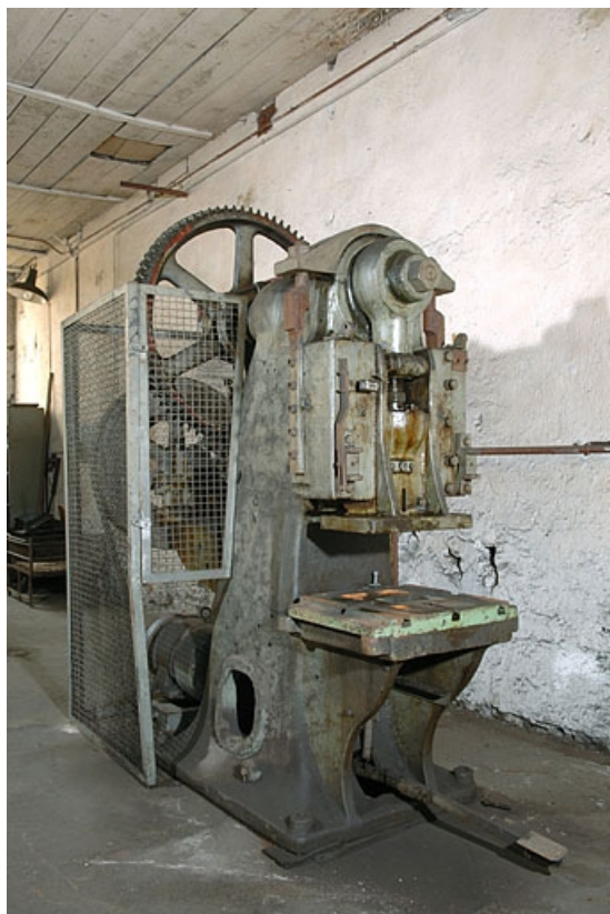
Vue de trois quarts gauche.

70, Corravillers R.D. 6, lieudit : Champs Fauvey