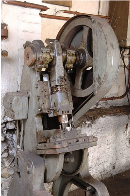
Vue de trois quarts gauche (partie supérieure).

70, Corravillers R.D. 6, lieudit : Champs Fauvey