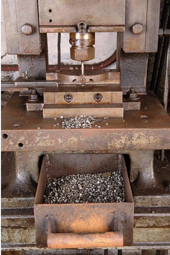
Le poinçon et son tiroir de réception.

70, Corravillers R.D. 6, lieudit : Champs Fauvey