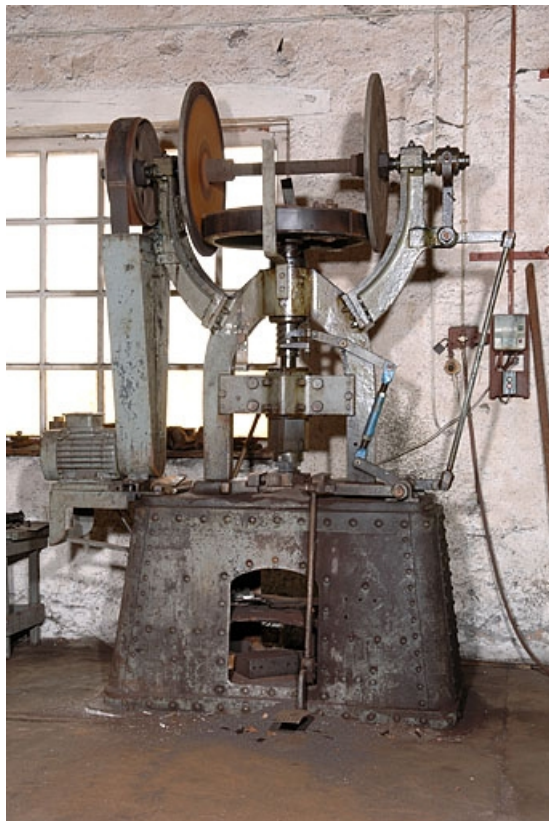
Vue de face.

70, Corravillers R.D. 6, lieudit : Champs Fauvey