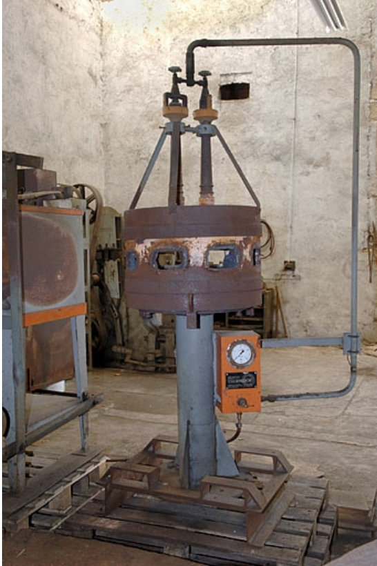
Vue de face d'un four.

70, Corravillers R.D. 6, lieudit : Champs Fauvey