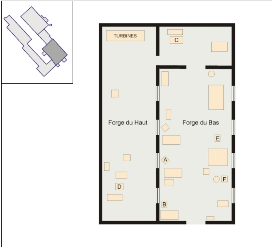
Plan de localisation des fours à gaz.