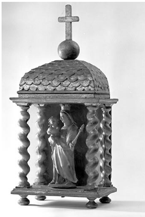
Vue d'ensemble de la statuette dans sa boîte vitrée.