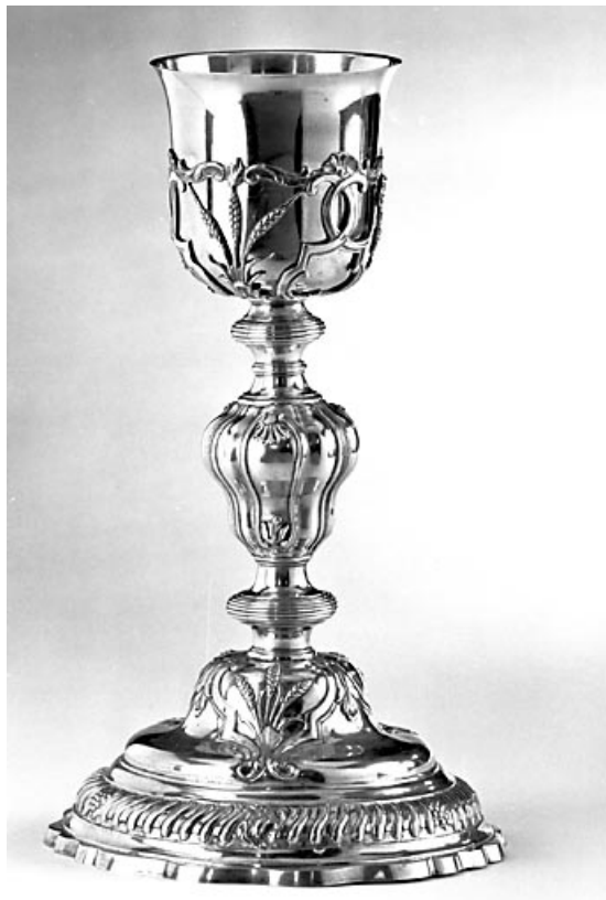
Vue d'ensemble du calice.