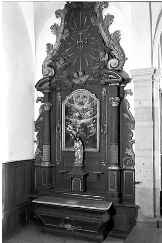
Vue d'ensemble de l'autel-retable latéral gauche.