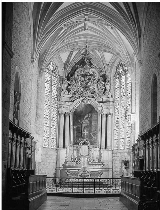
Autel-retable : vue d'ensemble.