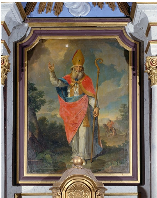
Saint Martin. 70, Montagney