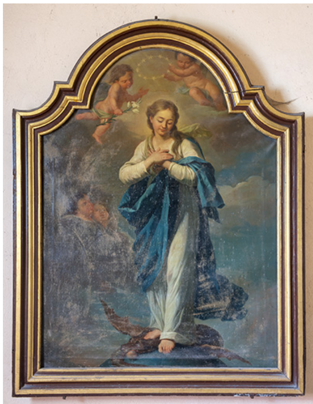
Tableau : la Vierge de l'Immaculée Conception. 70, Montagney