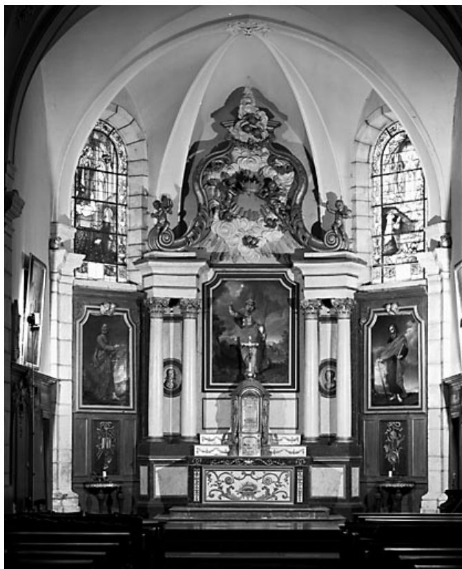
Vue d'ensemble. 70, Montagney