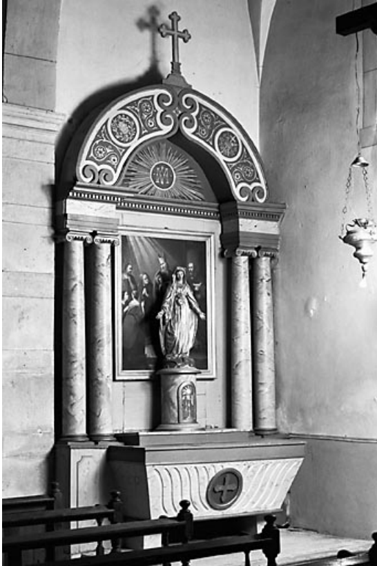
Vue d'ensemble de l'autel-retable latéral droit. 70, Chancey