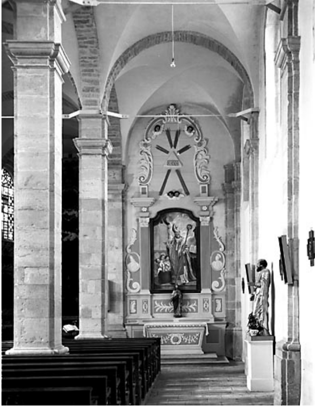
Vue d'ensemble de l'autel-retable latéral droit.