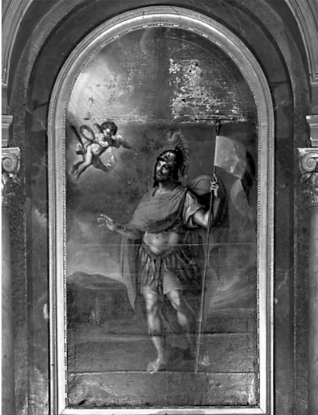
Retable : tableau saint Maurice