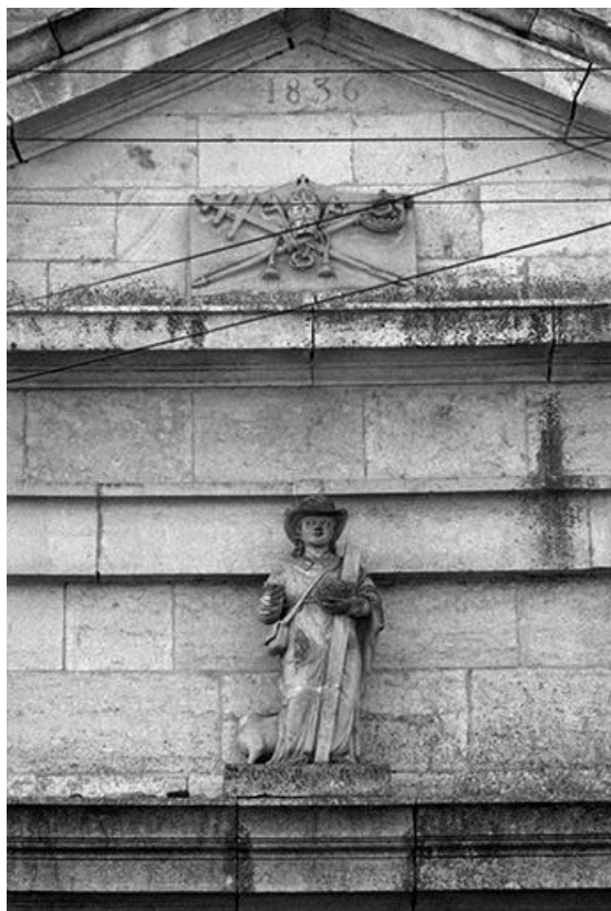
Vue d'ensemble avec cartouche.