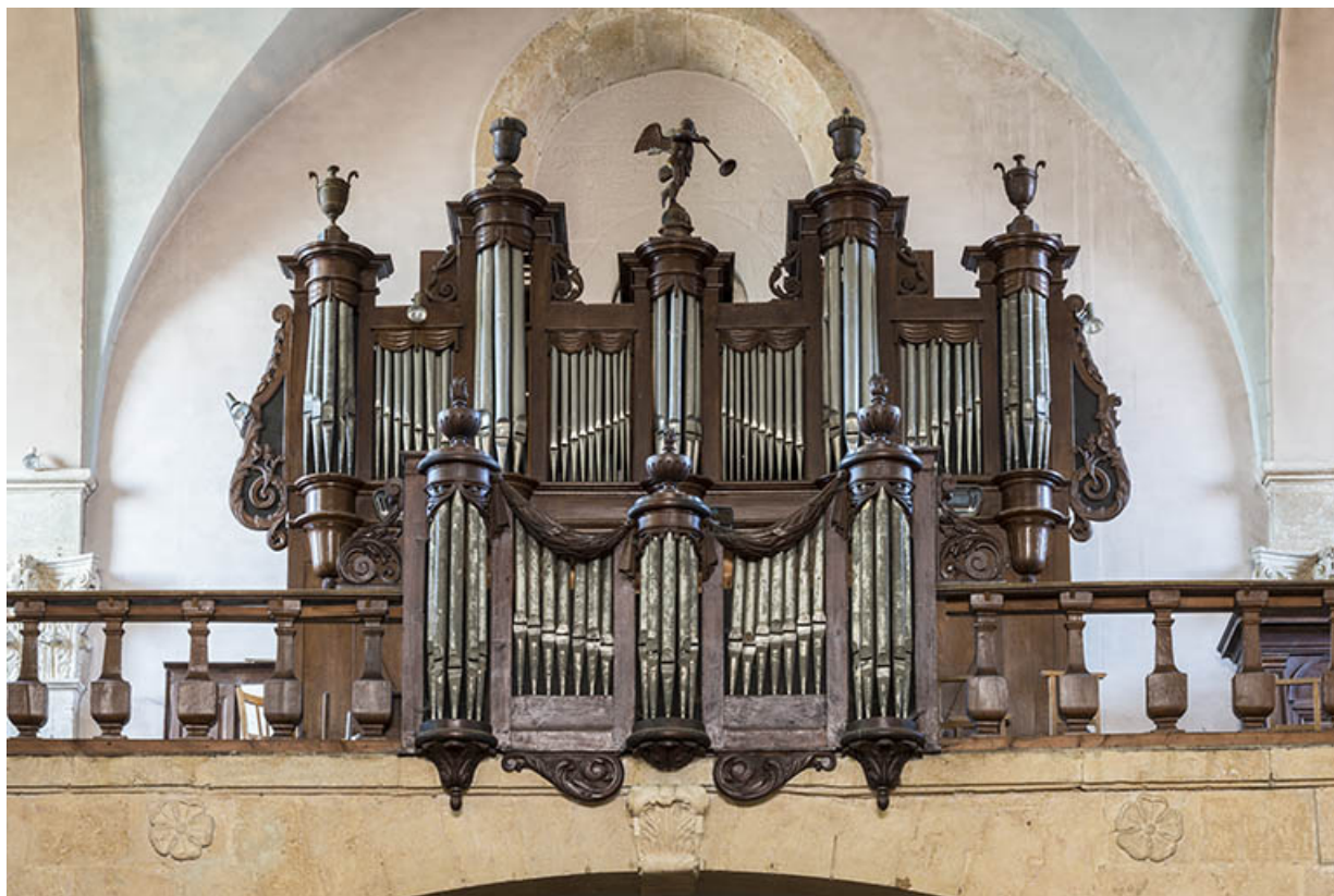
Vue de face, depuis la nef en 2018.

70, Scey-sur-Saône-et-Saint-Albin rue de l' Église