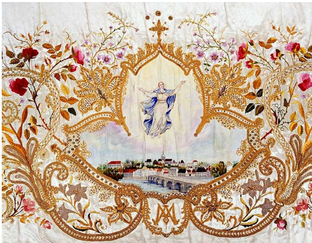
Détail de la partie centrale : Vierge de l'Assomption au dessus de la ville de Gray.