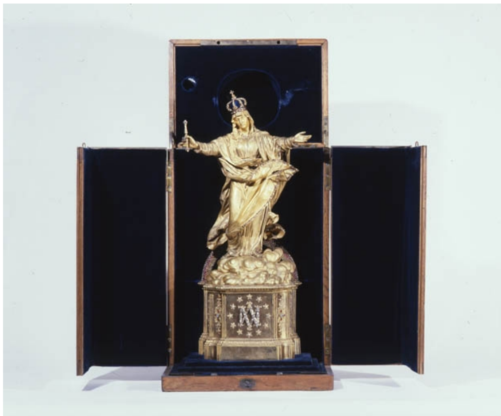
Ex-voto statue dans son coffre ouvert.