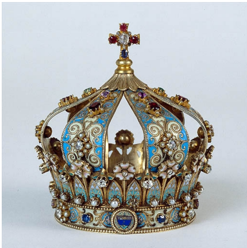
Vue d'ensemble rapprochée.