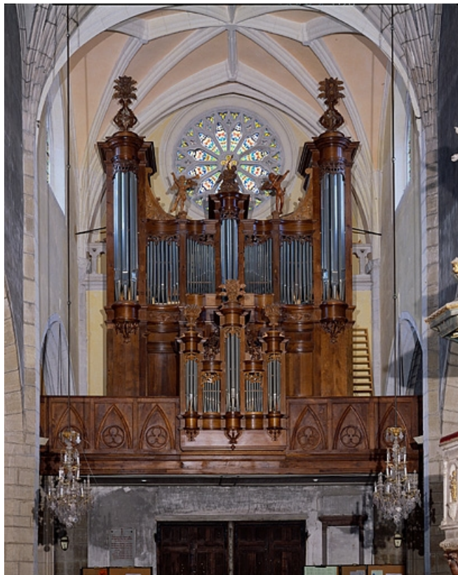
Grand orgue, vue d'ensemble.