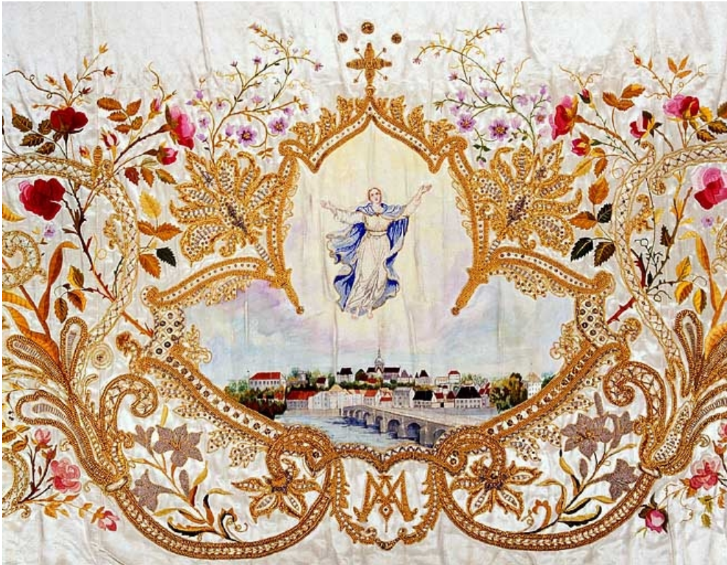
Détail de la partie centrale : Vierge de l'Assomption au dessus de la ville de Gray.