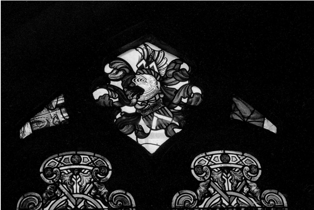
Tympan avec les armoiries de la famille de Vandenesse.