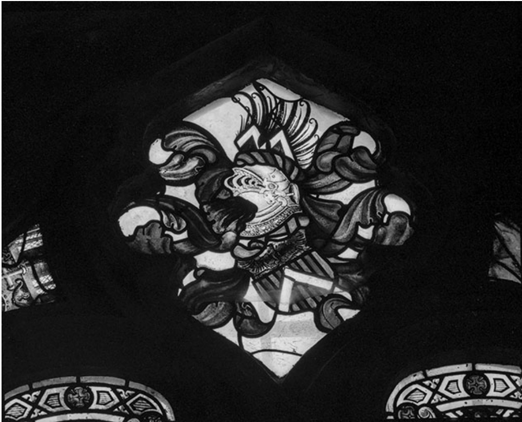
Tympan avec les armoiries de la famille de Vandenesse.