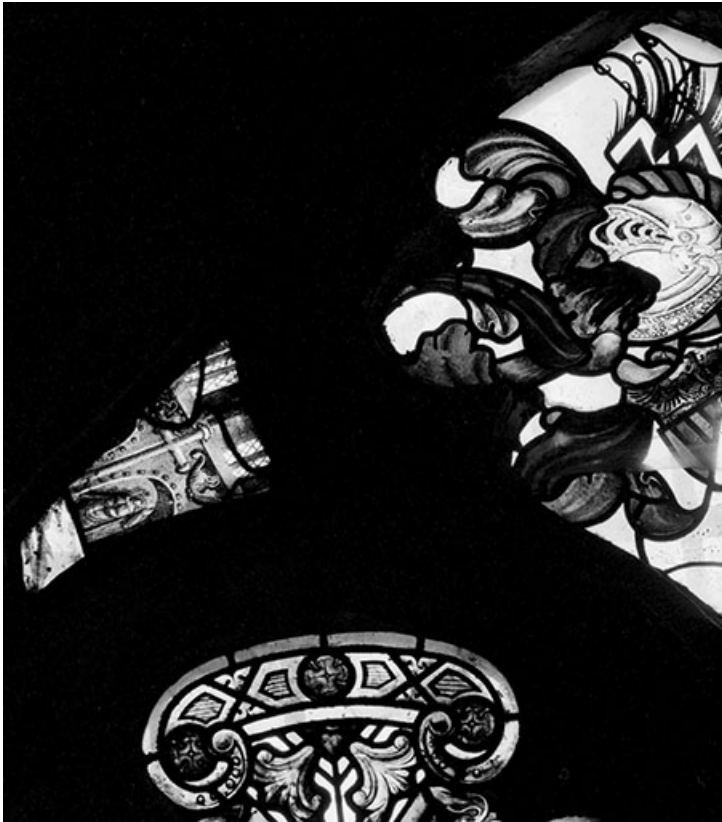
Détail : écoinçon gauche avec personnage et éléments d'architecture. 70, Gray place de la Sous-Préfecture