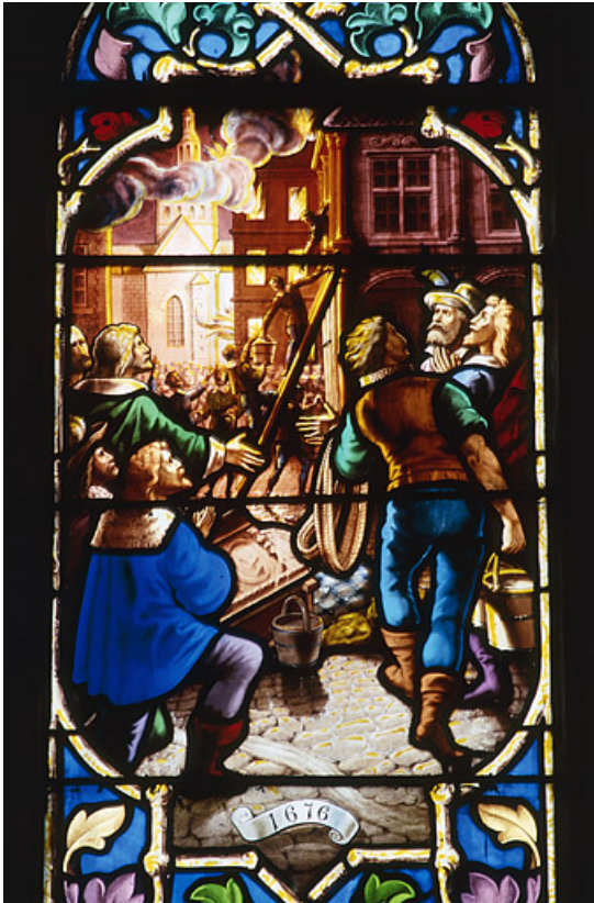
Détail de l'hôtel de ville préservé des flammes, 1676 70, Gray place de la Sous-Préfecture