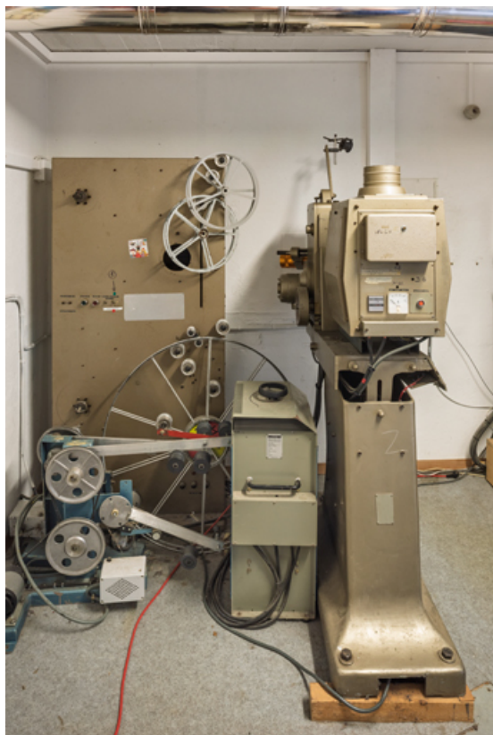
Vue d'ensemble de dos, avec le redresseur IREM et le dérouleur de film.

58, Saint-Honoré-les-Bains, 18 rue Henri Renaud