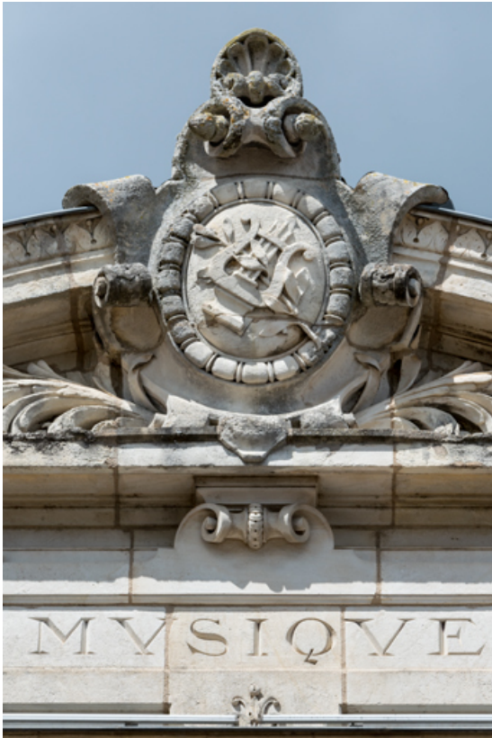
Travée gauche : décor du fronton.

58, Nevers, 8 place des Reines de Pologne