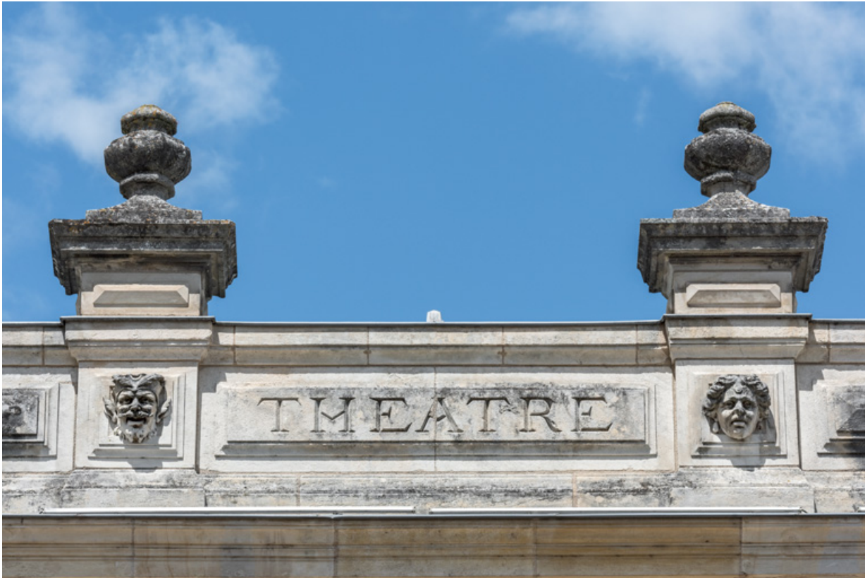
Partie centrale de l'attique, avec inscription et deux têtes.

58, Nevers, 8 place des Reines de Pologne