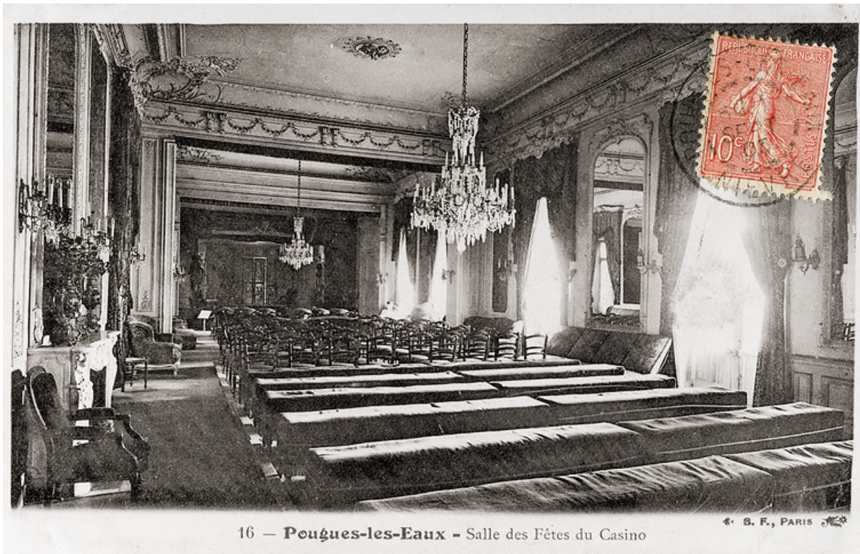
Salle de spectacle du casino construit en 1860-1863, vue en direction de la scène (mur sud-ouest). 58, Pougues-les-Eaux avenue de Conti