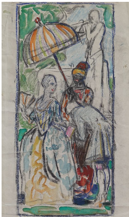
Le Baise-main, esquisse.