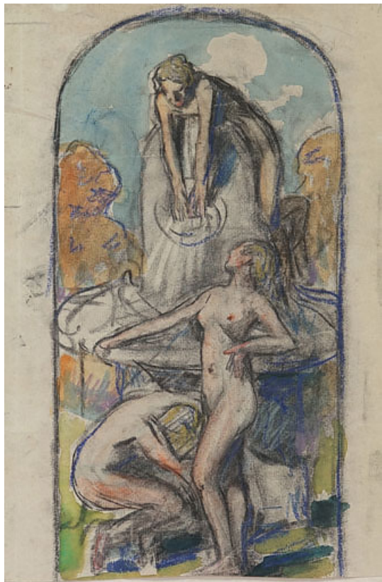
La Source, esquisse.