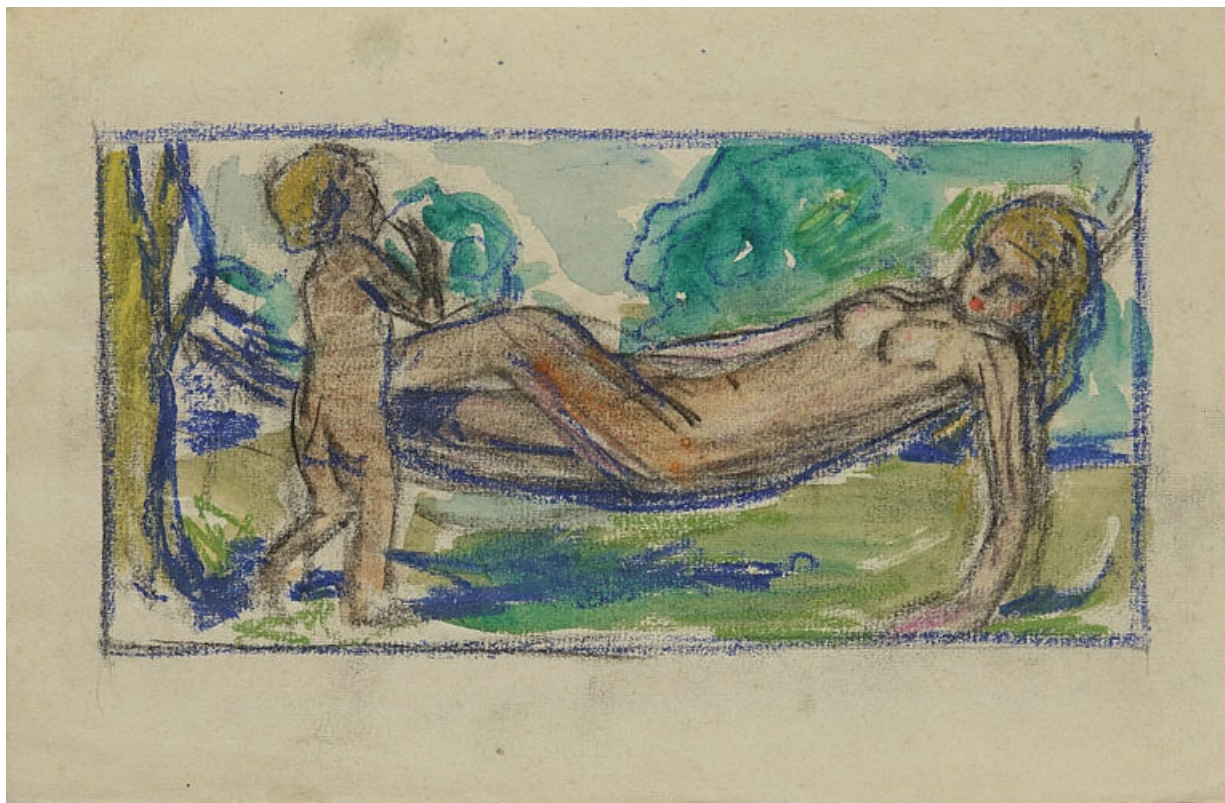
Allégorie féminine, le repos (?), esquisse.